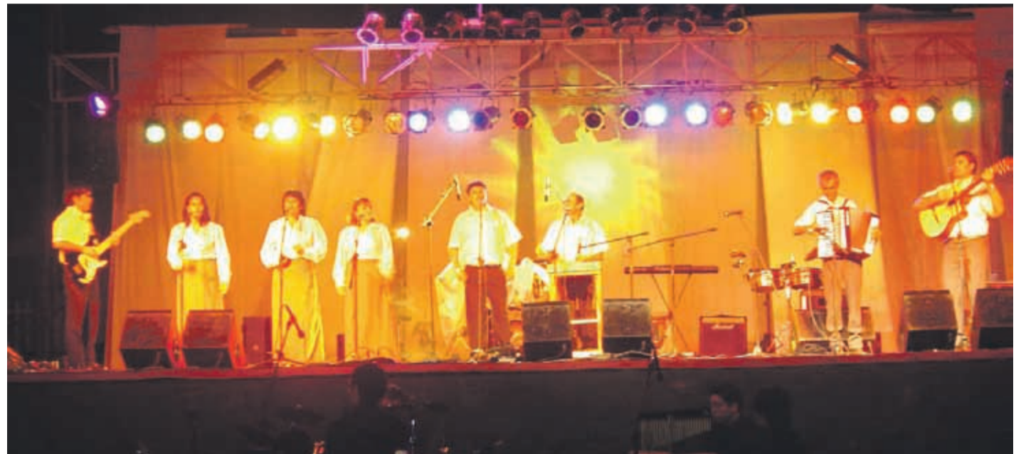
Ambos ediles coinciden que este año los eventos serán más austeros, considerando la crisis social que vive el país.

Sobre el certamen, el edil aseguró que “va a ser más austero, menos costoso, pero mantendrá su impronta de generar un espacio recreativo y gratuito para todos los vecinos de la localidad y los turistas. El certamen permitirá ubicarnos en la noticia de la región y