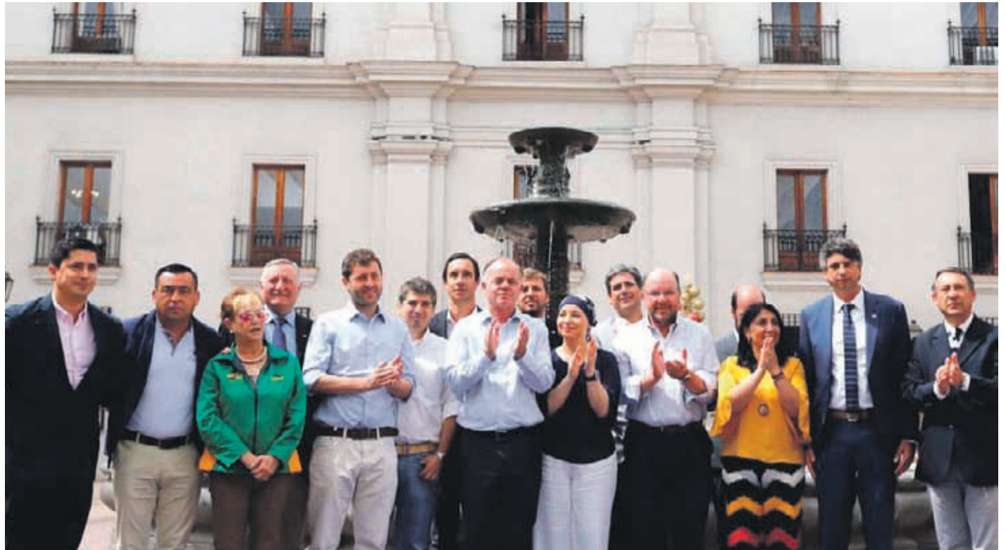
Ceremonia de lanzamiento de campaña “Chile se está secando” en el palacio de la Moneda.