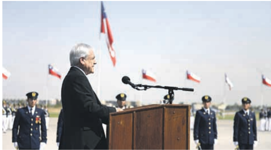
Los cuatro organismos denunciaron que las fuerzas de seguridad chilenas cometieron graves violaciones a los derechos humanos

El Partido Comunista quiere que el presidente Sebastián Piñera responda ante la Corte Penal Internacional por las violaciones a los derechos humanos ocurridas durante la crisis, denunciadas por distintos organismos, confirmó este jueves a Efe su líder, Guillermo Teillier. “Estamos estudiando una presentación ante la Corte Penal Internacional, hay un equipo de juristas que la están preparando y estará lista previsiblemente la próxima semana”, apuntó Teillier. El partido enviará al tribunal internacio-