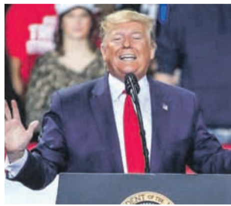
Según medios estadounidenses, Trump había autorizado el jueves por la mañana la operación.

Según el Pentágono, Soleimani desarrollaba “planes para atacar a los diplomáticos y miembros del servicio estadounidenses en Irak y en toda la