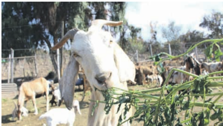
La sequía afectó a la Región de Coquimbo a tal punto que murieron más de 100 mil cabezas de caprino.

Son 119 comunas rurales de Chile bajo decreto de Zona de Emergencia Agrícola, abarcando desde Atacama hasta la región del Maule. Antes la escasez hídrica que afecta no solo a la provincia, sino a todo el país, el gobierno lanzó este viernes la cruzada que espera generar más conciencia en el cuidado del agua.