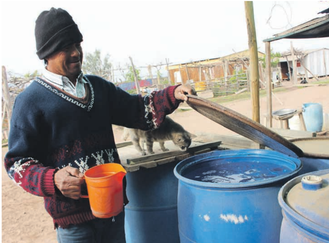
Son cerca de 350 familias de diversas localidades de la comuna que han tenido que sufrir las consecuencias de la falta de agua. EL OVALLINO

El Ministro de Agricultura, Antonio Walker dijo que “este terremoto silencioso, que es la sequía, tuvo su primera réplica en la Región de Coquimbo con la muerte de más de 100 mil cabezas de