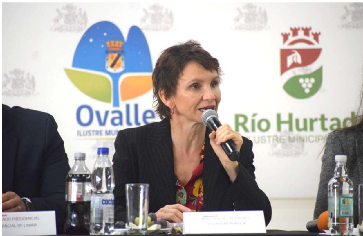
La ministra Carolina Tohá visitará la nueva sección del OS7 de Carabineros en la Prefectura Limarí-Choapa.

Es en ese sentido que la ministra del Interior y Seguridad Pública, Carolina Tohá, llegará hoy hasta la provincia del Limarí para conocer en terreno los avances en el combate contra el narcotráfico que el OS7