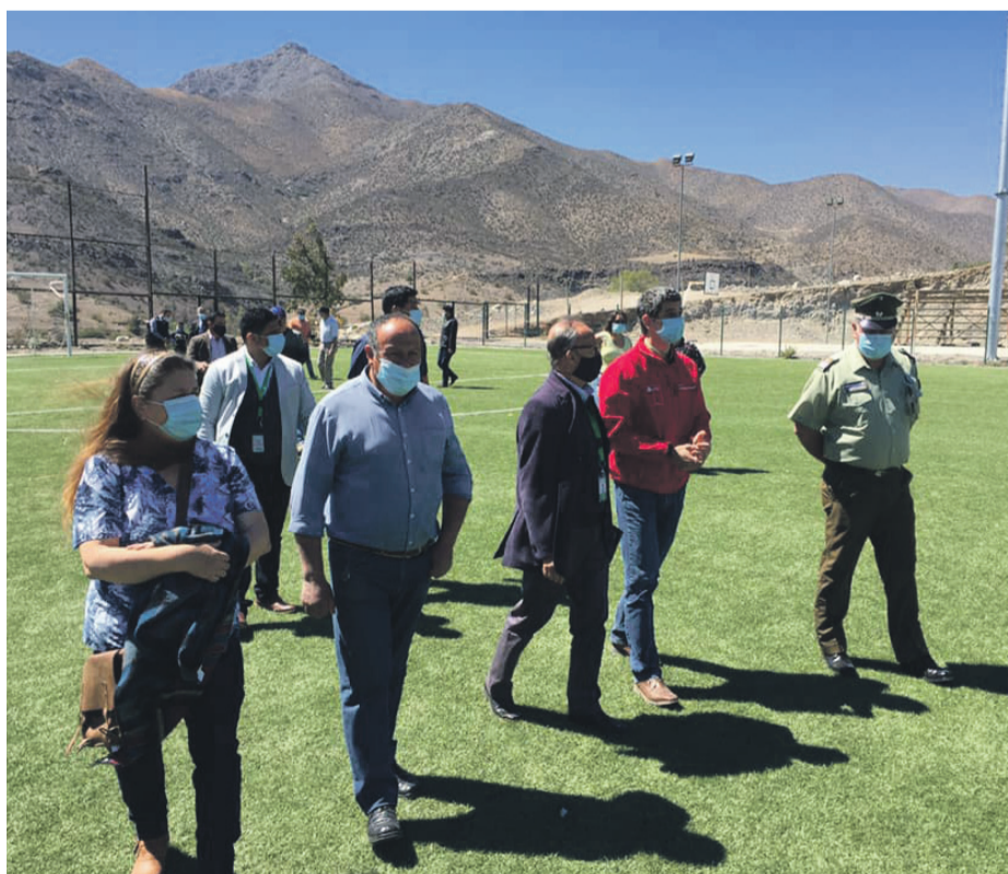
El Complejo Deportivo de Pichasca tiene una inversión de $260 millones, que podrán disfrutar, entre otros, el Club Olímpico de Pichasca.

disfrutar al aire libre siguiendo eso sí, todas las medidas de seguridad y prevención. Estos nuevos espacios van en la línea de brindar espacios de calidad a los habitantes frente a una temporada estival que se avecina, por tal motivo