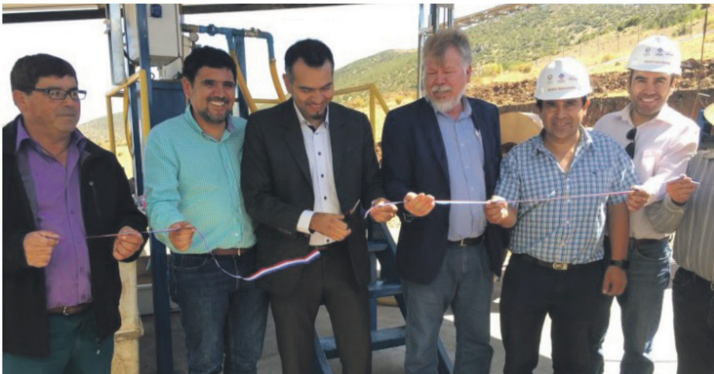
En la imagen se muestra la inauguración, en marzo de 2018, del “El Altar” de Punitaqui, a la que asistieron autoridades de la época. La planta nunca habría estado funcionando, pese a esto se llevó a cabo el corte de cinta.