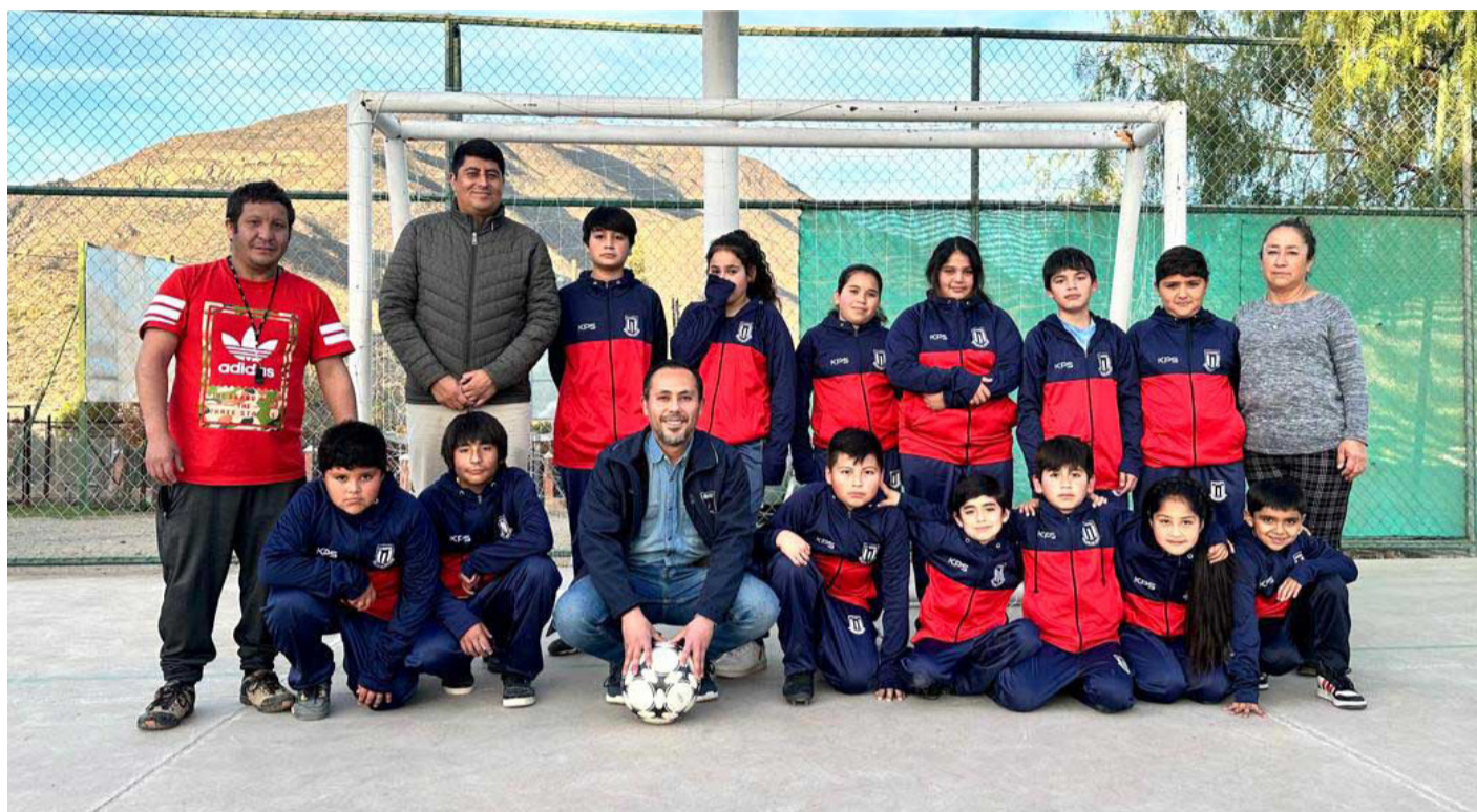
Son 30 los miembros de esta academia quienes se vieron beneficiados con la compra de nuevos material, gracias al aporte del FOSIS.

A través del programa Organizaciones en Acción del FOSIS, la Academia de Fútbol Infantil de Monte Patria, recibió un fondo de financiamiento superior a los 2 millones de pesos para la compra de balones de fútbol, implementos deportivos y el pago de