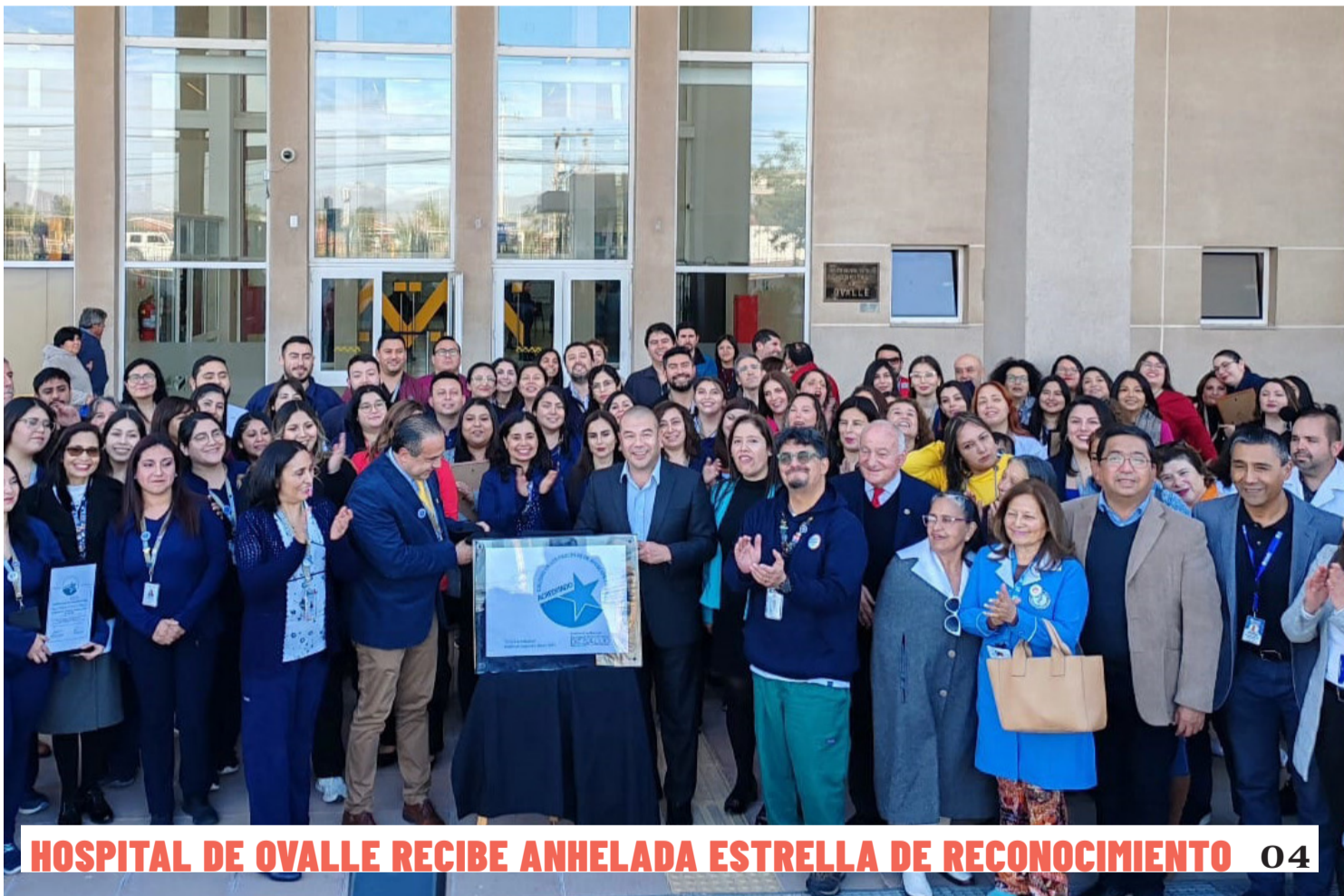
HOSPITAL DE OVALLE RECIBE ANHELA ESTRELLA DE RECONOCIMIENTO 04