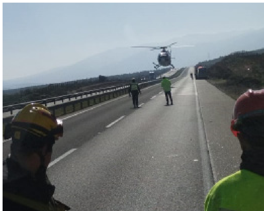
La menor herida tuvo que ser trasladada en helicóptero hasta el hospital de Coquimbo a raíz de las lesiones generadas en el volcamiento en el sector de Amolanas, en el límite de las provincias de Choapa y Limarí.

Según los antecedentes recabados por Diario El Día, el automóvil era