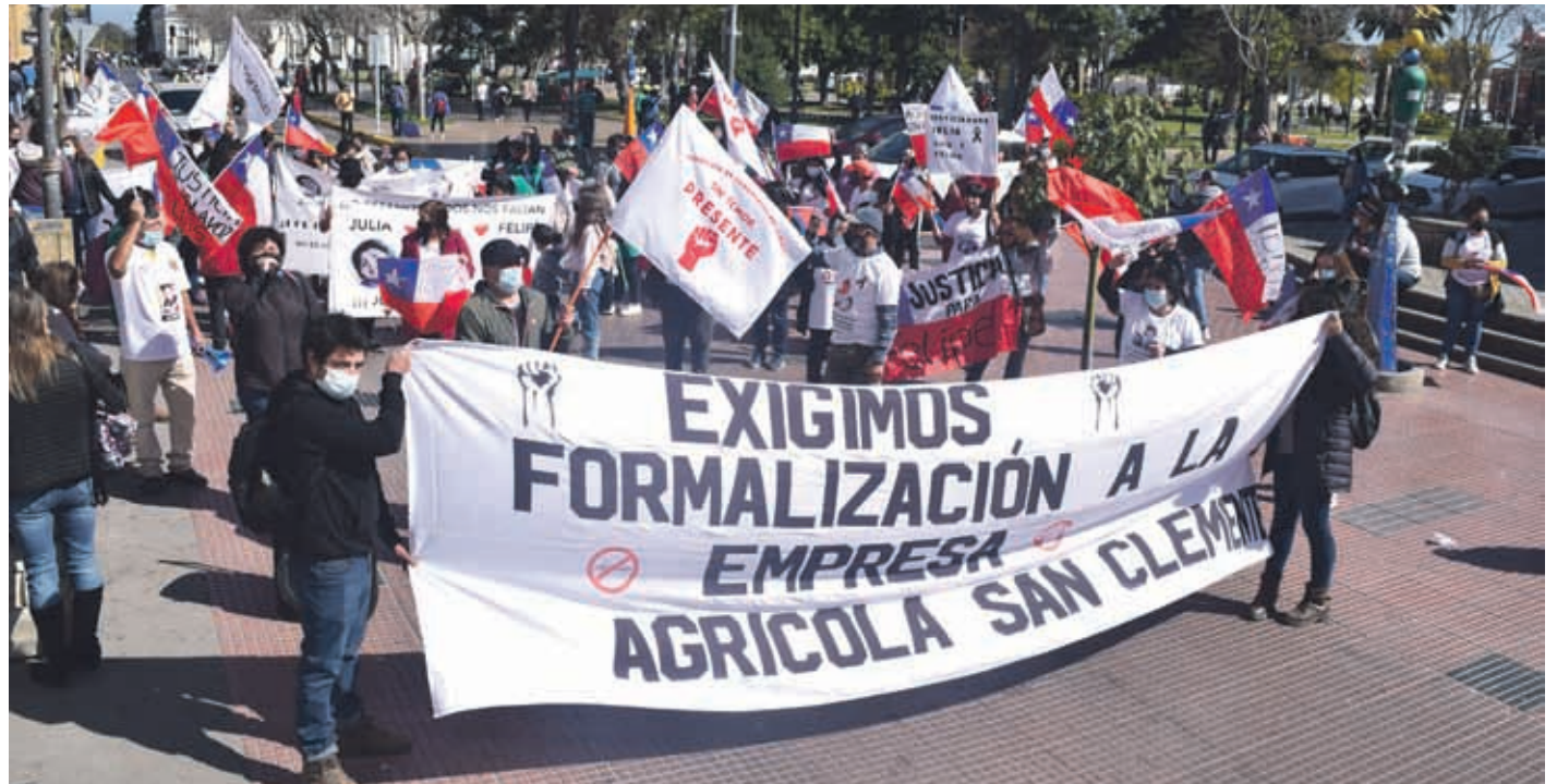
La manifestación para exigir justicia se realizó por las principales calles de la capital regional.

La primera parada fue frente a la fiscalía regional, en ese sector exigieron la agilización del caso, "es doloroso y triste tener que reconocer que a más de un año de estos hechos todavía no haya responsables, le pedimos a la fiscalía que cumpla con su traba-