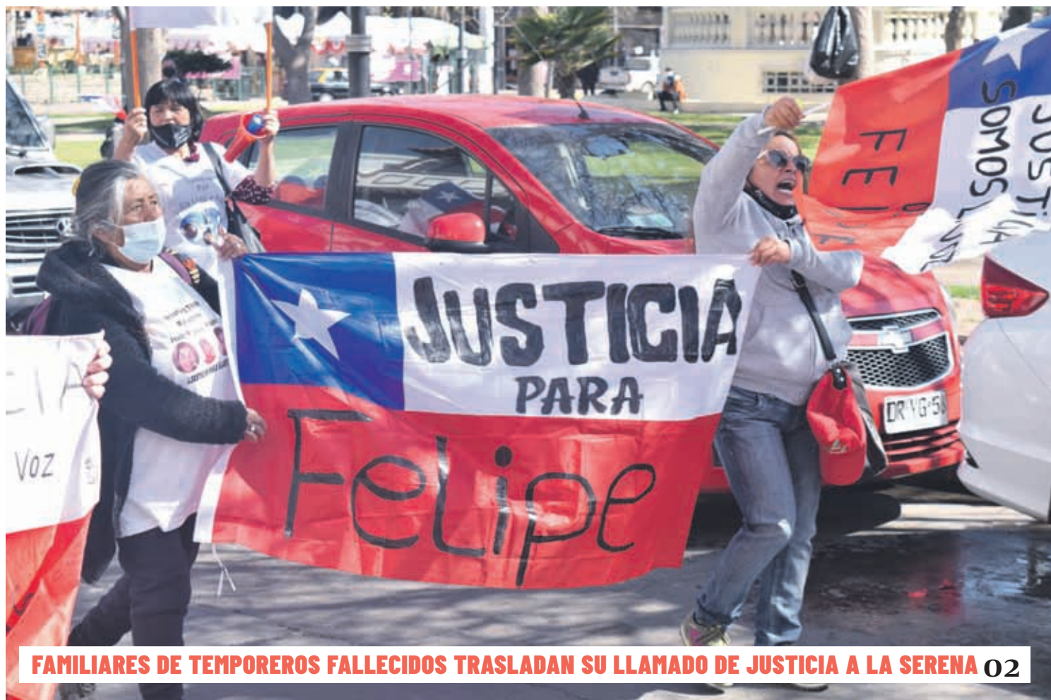
FAMILIARES DE TEMPOREROS FALLECIDOS TRASLADAN SU LLAMADO DE JUSTICIA A LA SERENA 02

Aunque todavía los proyectos no están aprobados por el nivel central, los recursos del decreto de Emergencia Agrícola estarían contemplados para ser destinados a geomembranas y tuberías PVC para el riego, así como para apoyar a los APR y a la alimentación caprina y apícola. 03