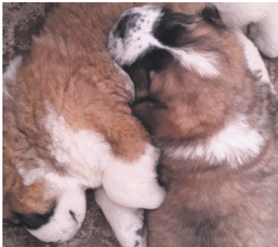
Duke y Dulce cuando eran unos cachorros, antes de ser dados en adopción.