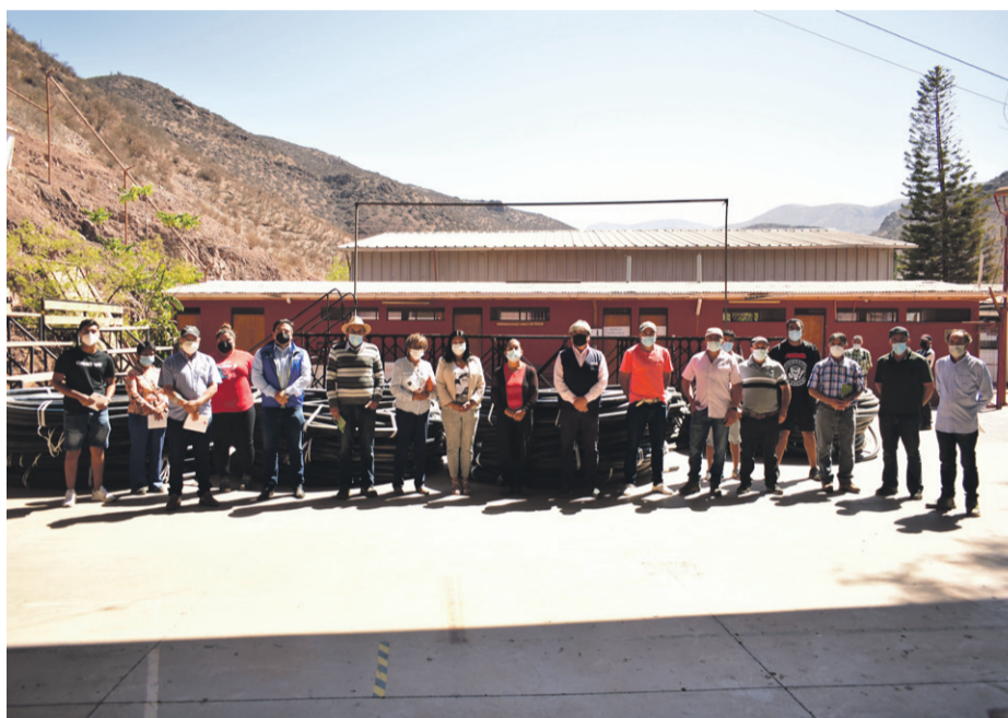
Los agricultores de la zona agradecieron el apoyo en medio de la sequía.

Fueron 25 pequeños agricultores que recibieron cerca de 100 metros de mangueras que permitirán dar un uso eficiente al escaso recurso hídrico existente.