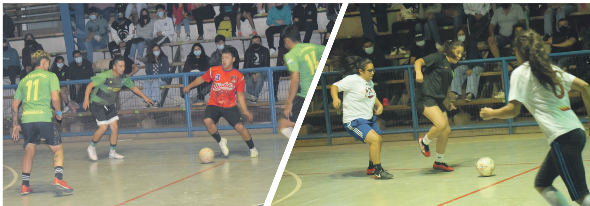
En el partido de la serie varones Unión Juvenil venció por 5 a 4.