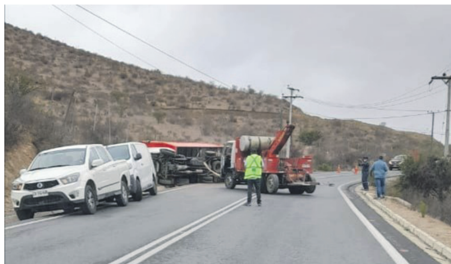
En El Hinojo volcó un camión que se trasladaba desde Ovalle hacia Punitaqui.