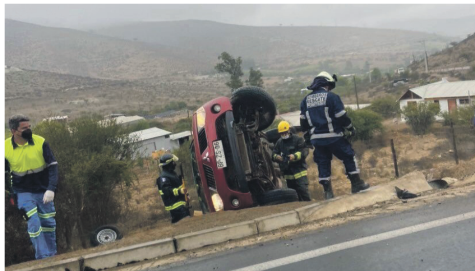
El primer accidente lo protagonizó una camioneta marca mitsubishi L200.