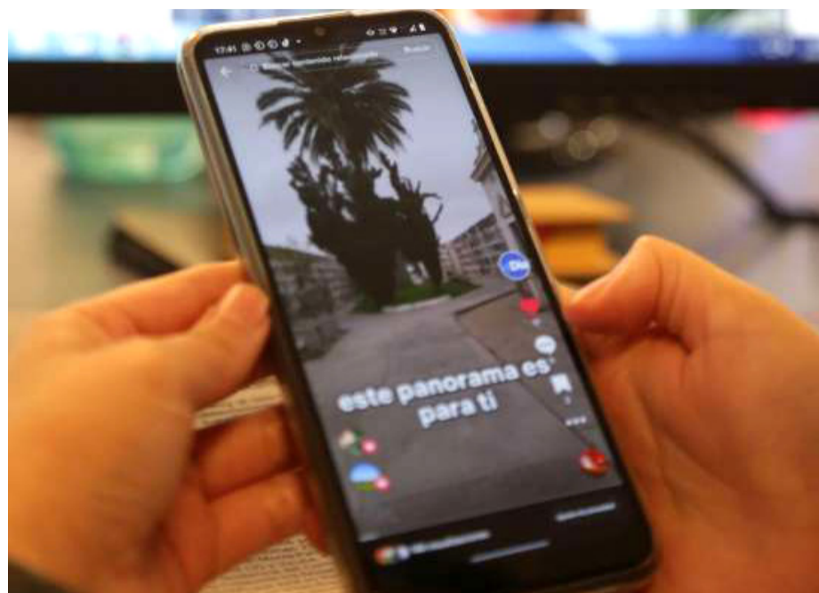
Tik Tok es una de las plataformas que ha revolucionado la forma de comunicarse.

De este modo, la plataforma multimedia ha tenido una expansión vertiginosa en el último bienio. Es así como pasó de tener 1.000 a