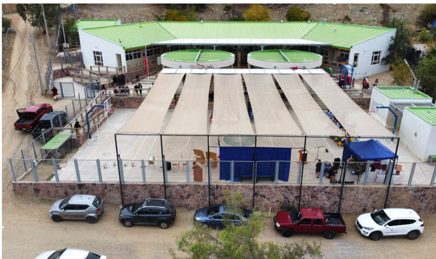
El nuevo sombreadero de la escuela permitirá proteger a los niños durante las clases de educación física.