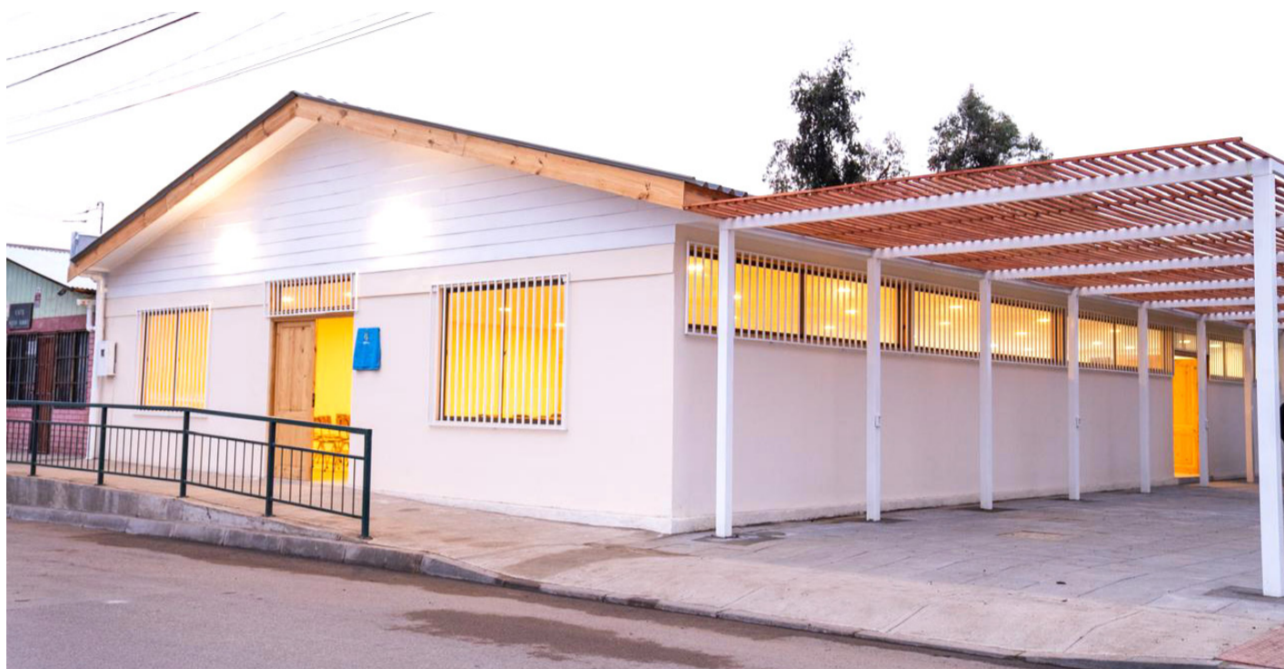
Las obras consideraron el mejoramiento del salón de eventos, una nueva techumbre, sistema de iluminación y piso de cerámica, entre otras mejoras.

Las obras de remodelación tuvieron una inversión que superó los 117 millones de pesos, aprobados por el Concejo Municipal de Ovalle, y consistieron en el mejoramiento del salón de eventos, el área de cocina y la habilitación de nuevos servicios higiénicos. El recinto comunitario cuenta con todas las condiciones necesarias para la realización de actividades comunitarias y recreativas.