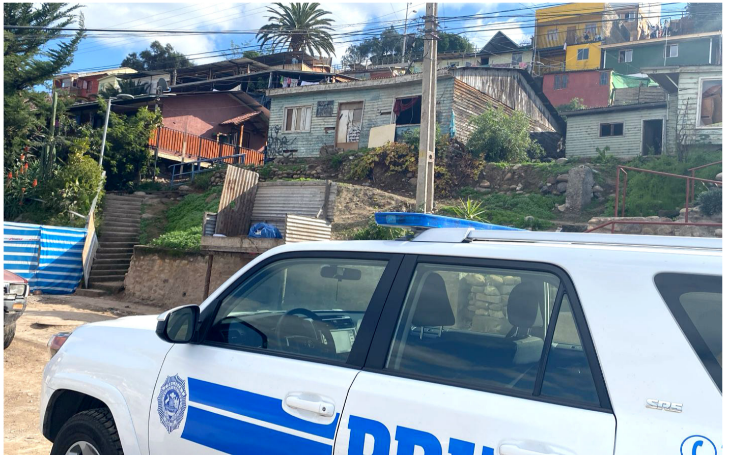
El Ministerio Público determinó que la Brigada de Homicidios de la PDI indague el crimen ocurrido en Ovalle.

A esto se suma el empadronamiento que hicieron los oficiales de la PDI