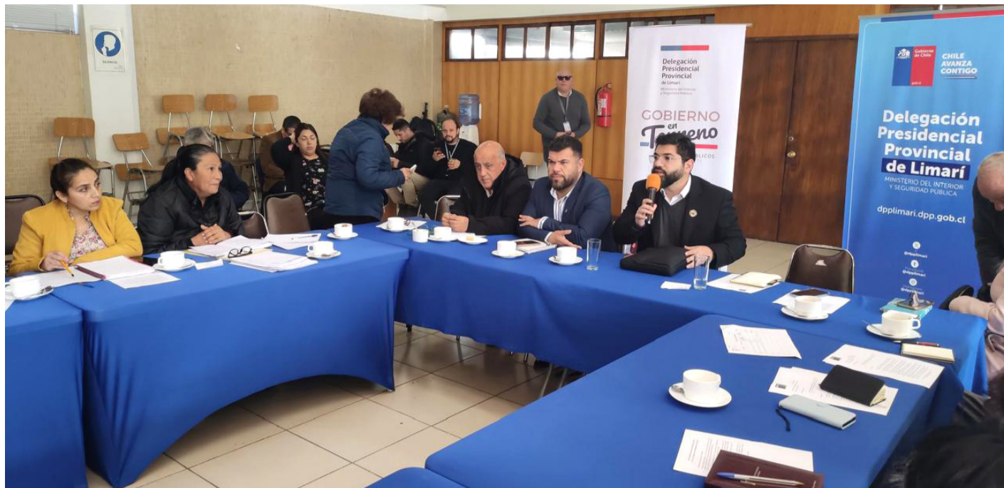
En la última Mesa Regional Caprina se dieron a conocer los detalles de la próxima campaña de desparasitación para esta temporada.