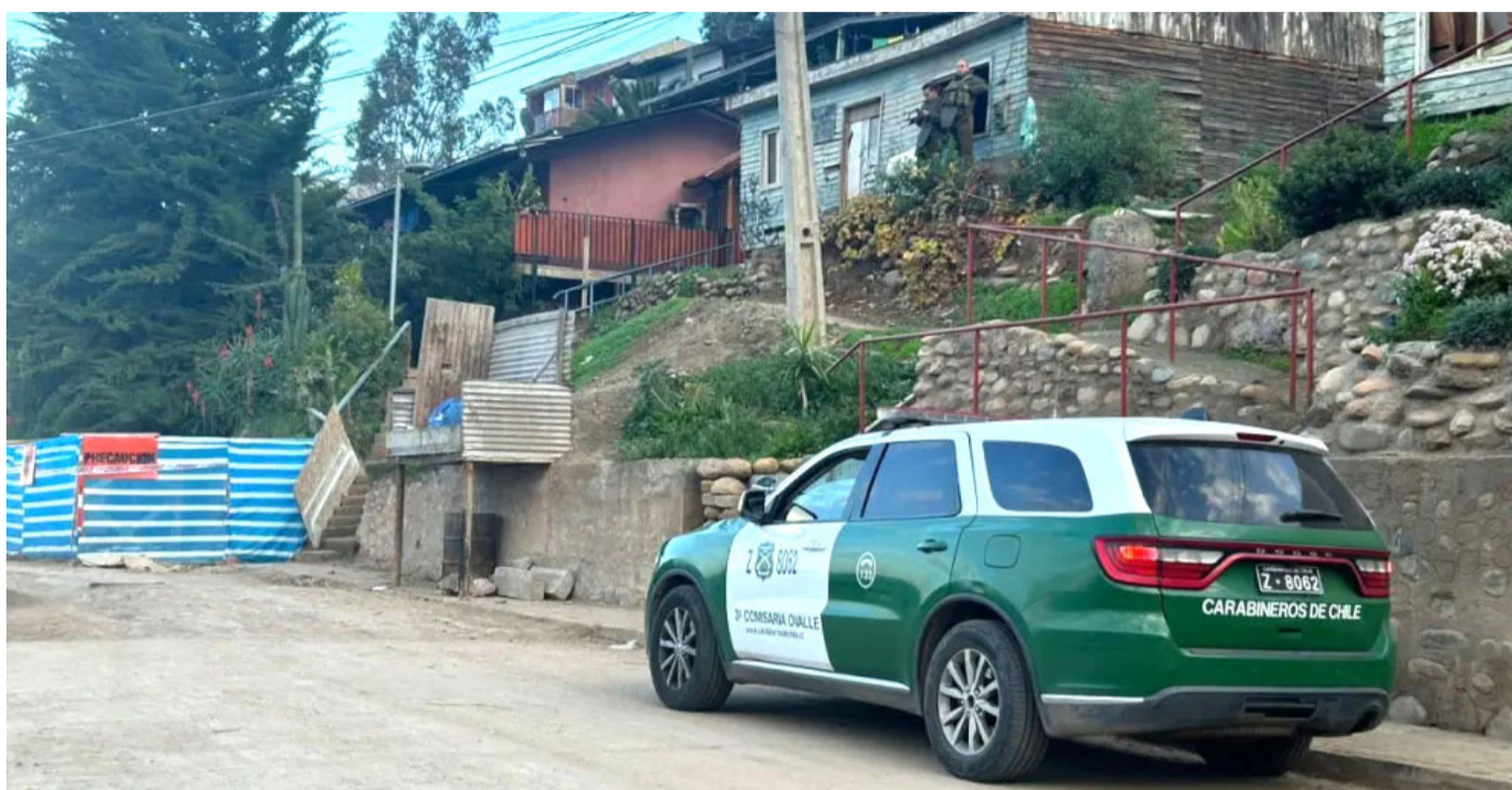
El crimen ocurrió en la sede del Club Social y Deportivo Bellavista, hoy abandonada.