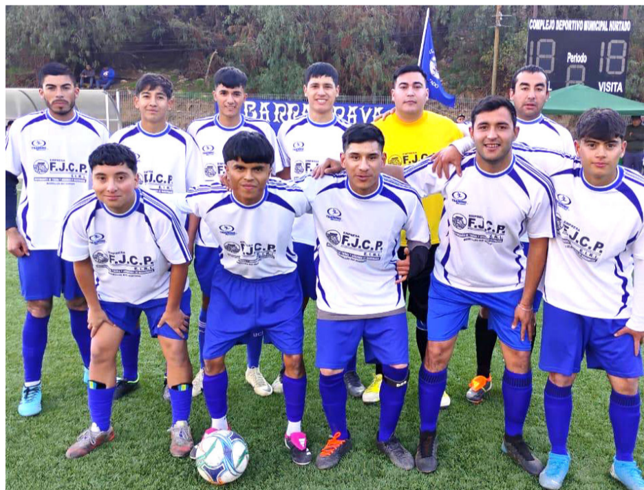
Diez son los equipos que participan en el certamen.

Los equipos participantes son Galvarino de Hurtado, Imperio Serón, Deportivo San Pedro, U. Fundina y Olímpico de Pichasca en el grupo A. Mientras que U. de Chile Samo Alto,