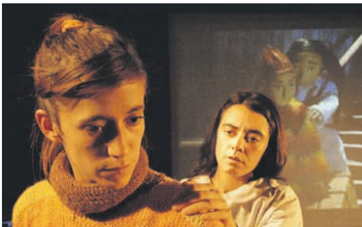
MALEZA SE TITULA ESTE PARTICULAR MONTAJE en el que los asistentes al TMO podrán ver cómo muñecos y seres humanos narran esta historia paralelamente.

Cabe destacar que la obra es una reflexión en torno al duelo y el desamparo en la infancia, profundizando en la psicología de su protagonista, que durante 45 minutos refleja los maltratos que sufre Ana en manos de