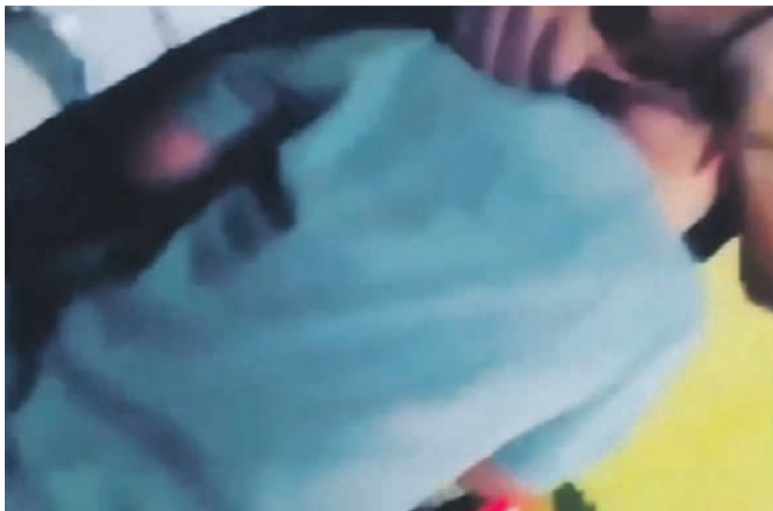
EN EL TRIBUNAL DE FAMILIA DE OVALLE se llevó a cabo la primera audiencia para definir la tuición provisorio de los menores.