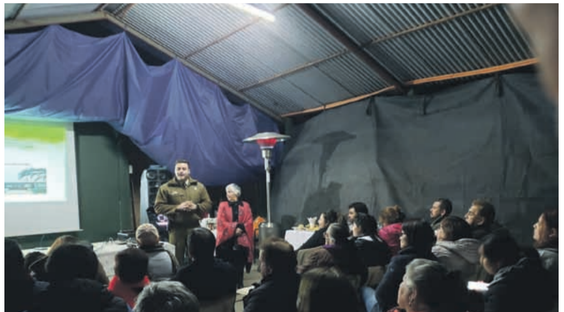
FUERON CERCA DE 60 LOS VECINOS QUE LLEGARON A LA UNIDAD para ser parte de la actividad organizada por Carabineros de la Subcomisaría de Monte Patria.

Fueron al menos 60 los vecinos que asistieron a la jornada organizada por esa unidad para interiorizarse sobre temas como la flagrancia, sistema S.T.O.P., además de otras estrategias para combatir la delincuencia.