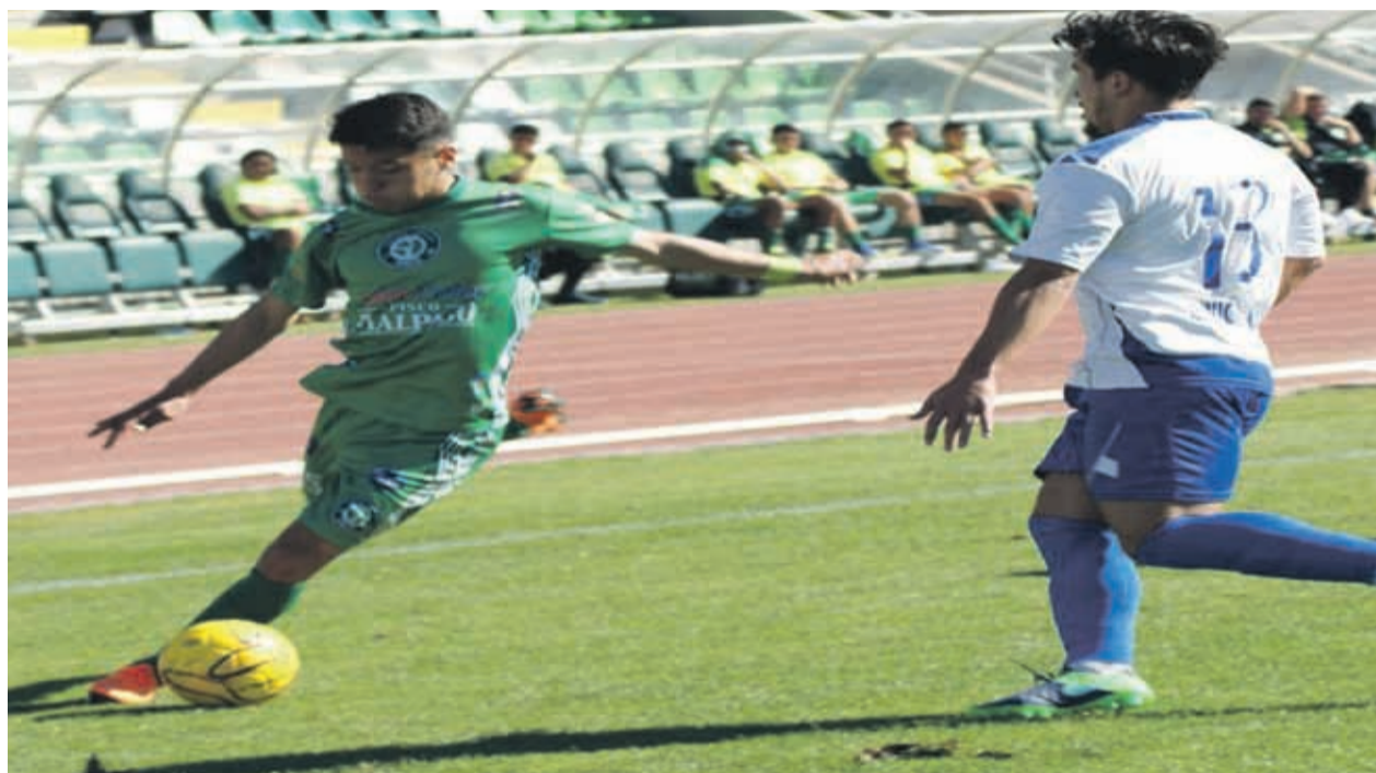
CSD OVALLE enfrenta esta noche a U. Casablanca en el Estadio Diaguita.

“Es un buen horario, la gente podrá ir después del trabajo y esperamos que nos vayan a apoyar”