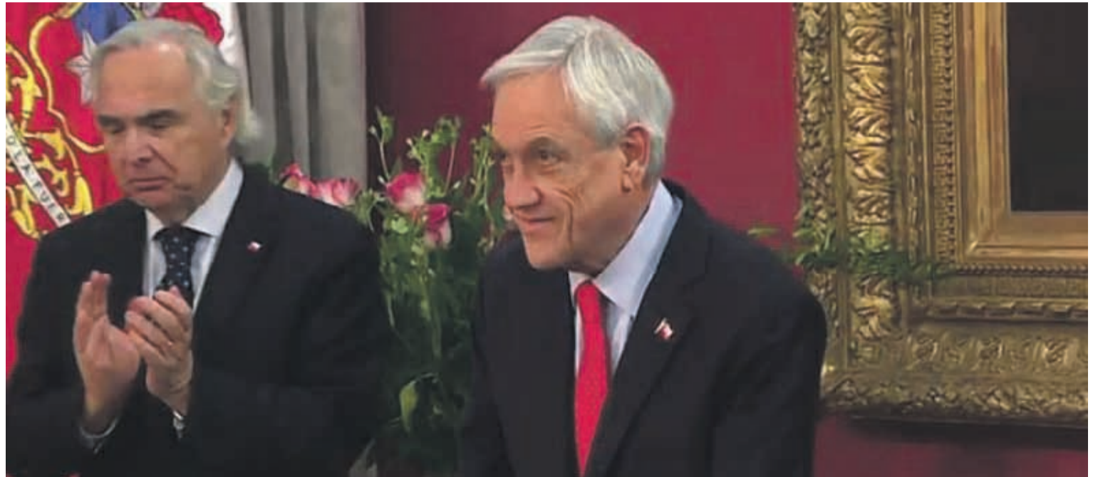
SEIS MINISTERIOS CAMBIARON DE TITULAR la tarde de este jueves tras el anuncio en La Moneda. CAPTURA DE PANTALLA

En el Ministerio de Salud se reemplazó a Emilio Santelices por el titular del Gobierno anterior: