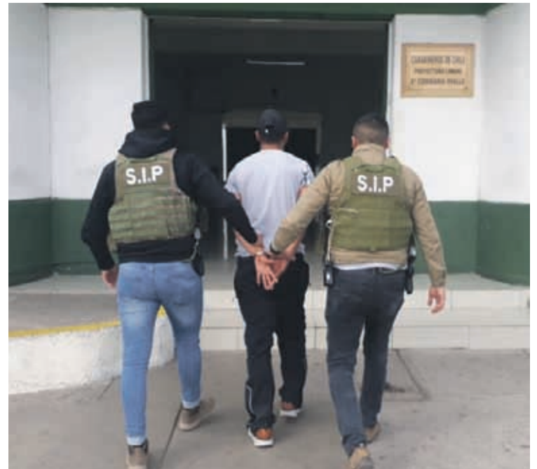
EL CONDENADO PASARÁ HOY A DISPOSICIÓN del Juzgado de Garantía, para su respectiva formalización y comenzar al cumplimiento a las penas efectivas pendientes.

Por un ilícito perpetrado en el año 2016, por el cual fue señalado por el Ministerio Público por el delito de robo con violencia, se concluyó un proceso judicial en su contra con una condena de cuatro años de