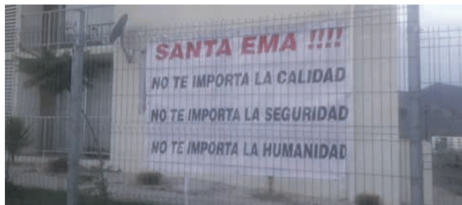
CON LIENZOS EN EL FRONTIS del conjunto habitacional, copropietarios expresan su molestia.