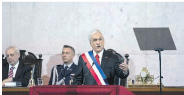
LA ENCUESTA MIDE DATOS COMO LA EVALUACIÓN de la seguridad del país, economía y los actores políticos. PRESIDENCIA