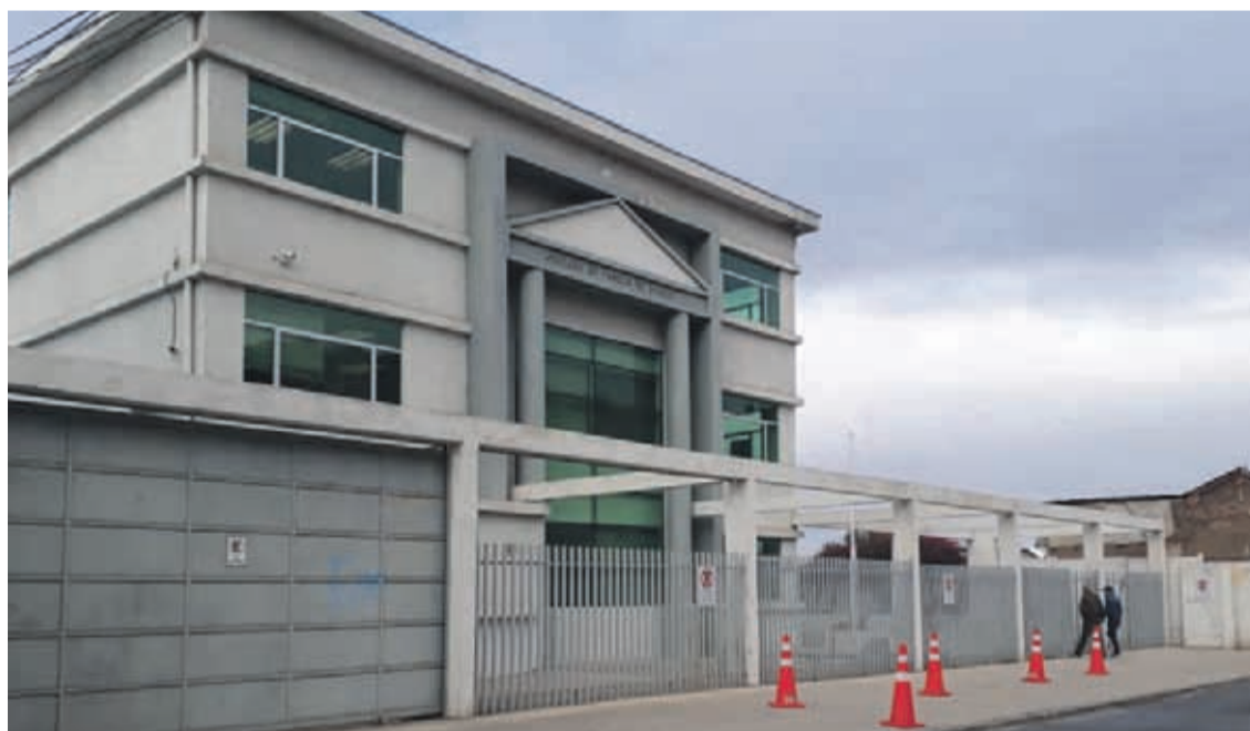
LOS HECHOS DE EVIDENTE VIOLENCIA llevaron a que los padres de los niños tomaran acciones legales y así poder conseguir el cuidado definitivo de sus hijos.

Recordemos que durante este fin de semana, tres videos circularon por las redes sociales el cual registraban a una madre amenazando con un cuchillo a su hijo mayor, mientras trata de convencer a su pareja para ser acompañada al consultorio tras una visita médica de la niña más pequeña.