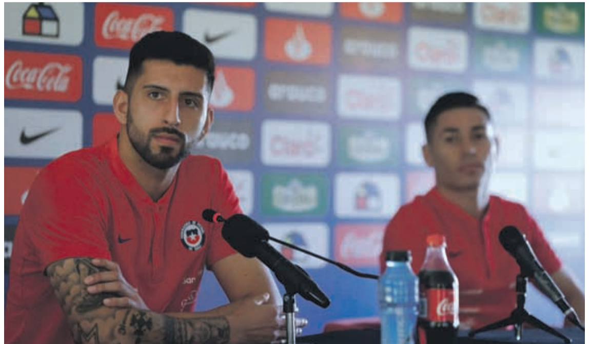
LOS JUGADORES DE LA SELECCIÓN CHILENA DE FÚTBOL GUILLERMO MARIPÁN (i) y Oscar Opazo participan en una rueda de prensa este jueves, en el Otho Spa Sport en Itu (Brasil).

“Son los goleadores, se entienden muy bien y llevan jugando juntos muchos años en la selección. Tienen grandes cualidades y yo como defensa me quedo muy tranquilo cuando estamos en fase ofensiva”, indicó.