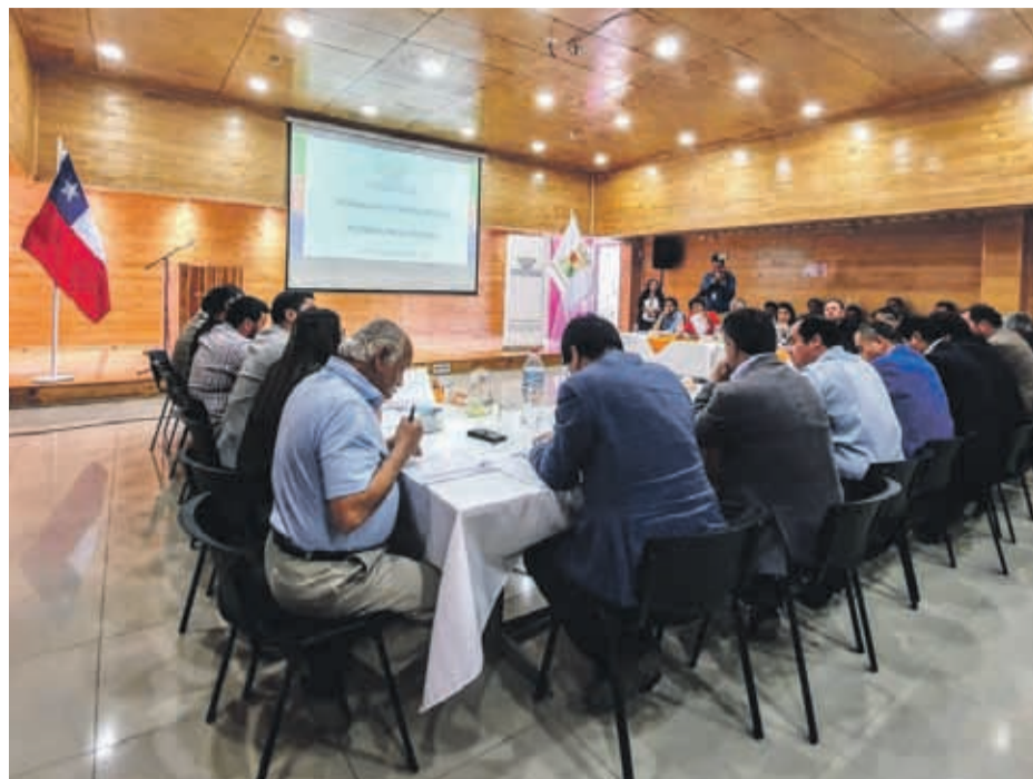
Los alcaldes de la región lideran el proceso participativo.