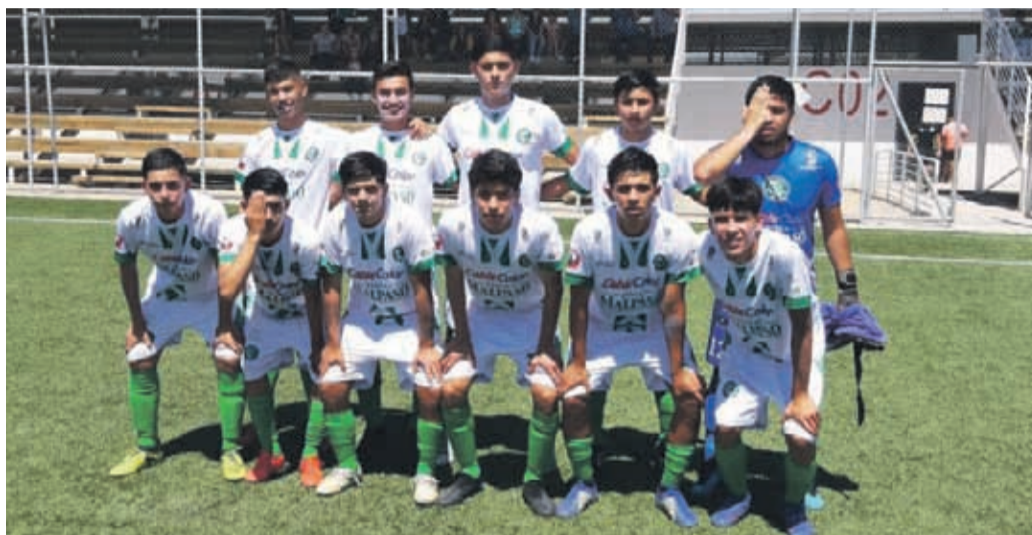
CSD Ovalle Novatos irá con todo a conseguir el tercer lugar del campeonato juvenil.

Los limarinos disputarán el tercer lugar este martes ante Lautaro en el principal recinto deportivo del país, en un partido de importancia para el club.