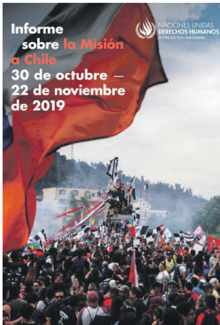
El informe fue publicado el pasado viernes.

ciertas violaciones a los derechos humanos, en particular el uso indebido de armas menos letales y los malos tratos, son reiteradas en el tiempo, en el espacio y con respecto a quienes son los supuestos perpetradores y las víctimas”.