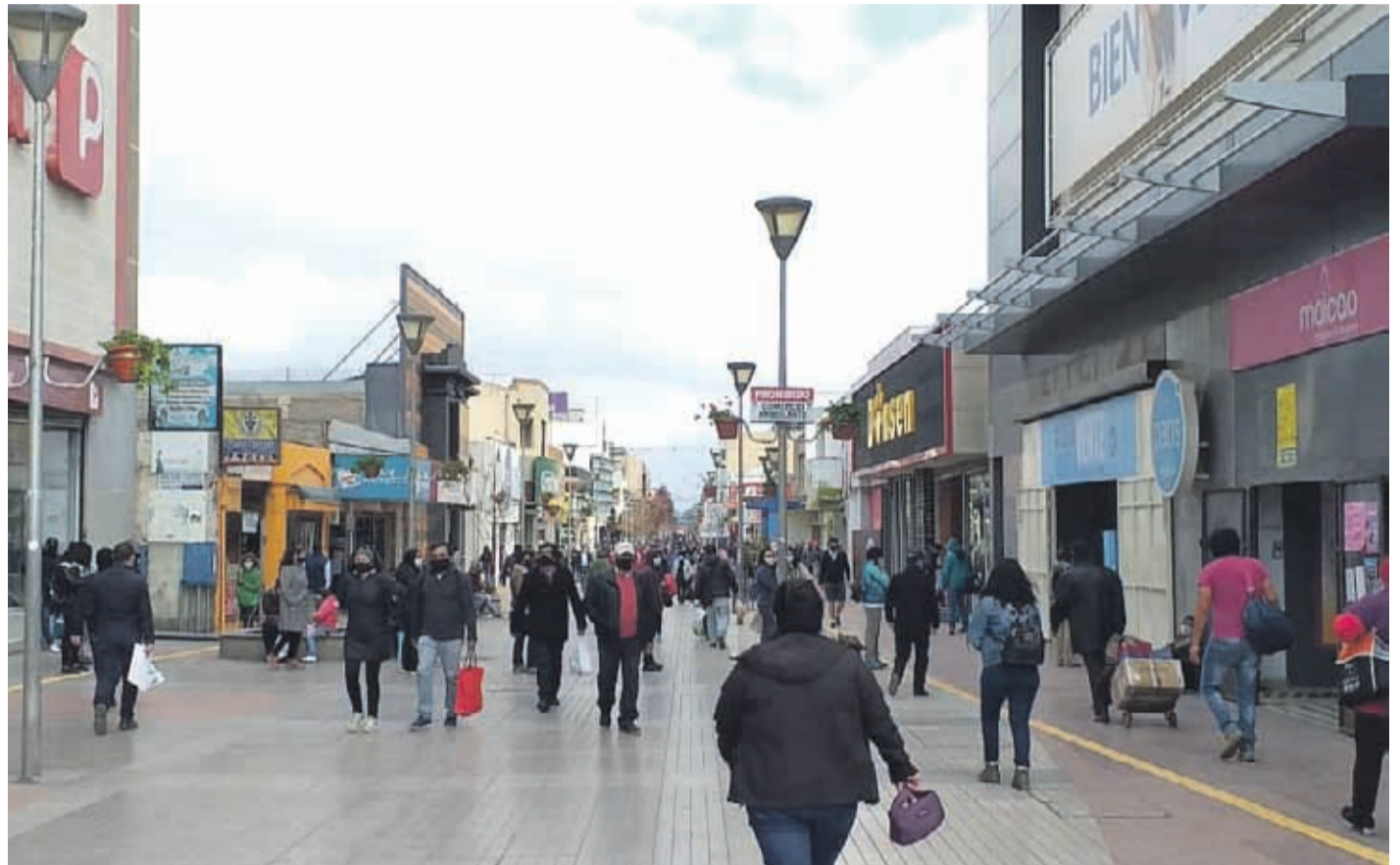
Los contagios no se detienen en la región de Coquimbo, totalizando 1.676 desde que se registró el primer caso.

Con todo, la provincia de Limarí suma a 51 casos nuevos, mientras que la comuna de Ovalle totaliza hasta la fecha a 392 personas contagiadas desde el primer caso conocido en el mes de marzo. Mientras que la comuna de Monte Patria alcanzó el centenar de