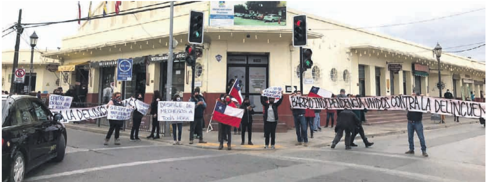
La movilización se realizó en la intersección de calle Victoria e Independencia.