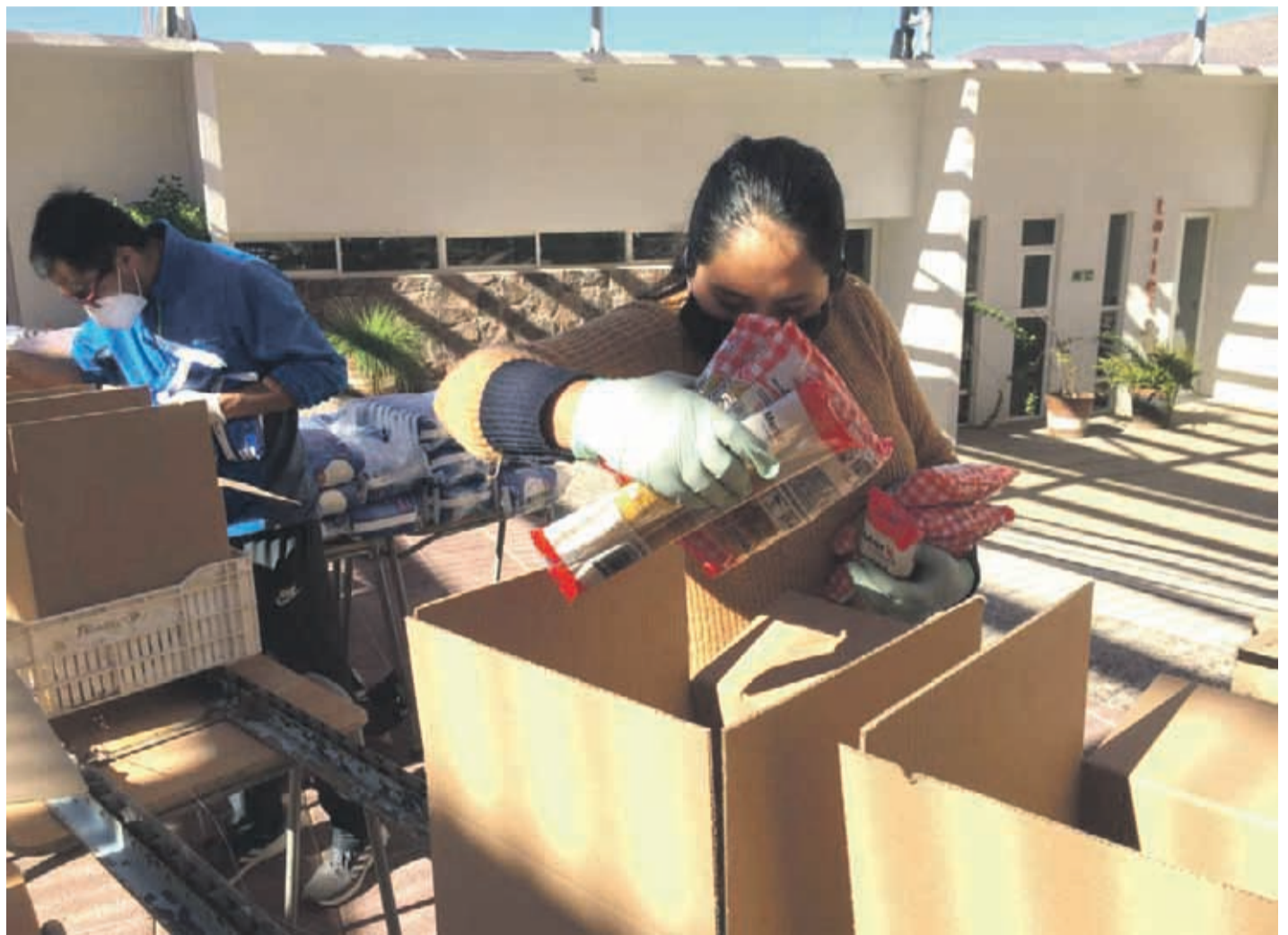
Funcionarios del municipio ayudan en implementar las cajas para familias de la comuna.