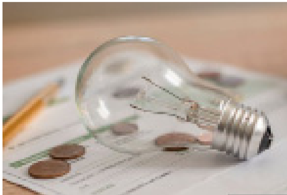
Las alzas por el componente por el precio de la energía - es decir el 70% de la boleta - se verá desde el 1 de julio.

Desde las empresas eléctricas aseguran que las cuentas están prácticamente congeladas desde 2019, a raíz del estallido social y la pandemia, y lo que veremos en los próximos meses será un proceso gradual de ajuste. Economistas afirman que este incremento será un duro golpe para el presupuesto familiar y de las Pymes.