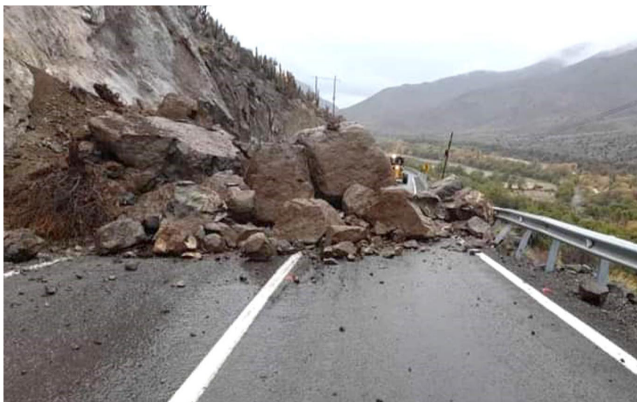
En Río Hurtado, hubo una afectación en la ruta interior, en donde tuvo que ir personal de Vialidad a despejar el camino.

“Cuando ya terminó este sistema frontal, ya demostramos nuestra alegría, conversamos con los vecinos, ellos muy emocionados por el evento. Esta es una comuna que necesitaba del recurso hídrico para su desarrollo, productores, familias, todos en general. Tenemos situaciones que resolver, ya nosotros empezamos a pensar en el post evento, tenemos dificultades con familias sin electricidad, caminos que están complejos y algunos vecinos que están incomunicados”, cerró.