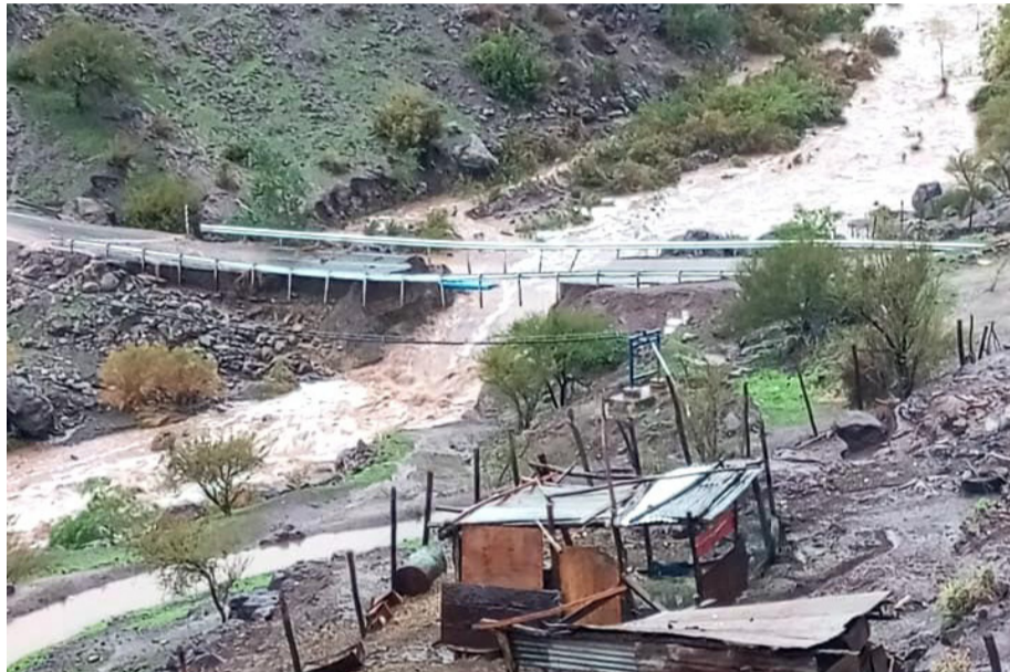
En la Ruta D-783, que conecta el Valle Hermoso con Matancilla, en Combarbalá, el tránsito se encuentra suspendido por la destrucción del puente sobre río Pama.