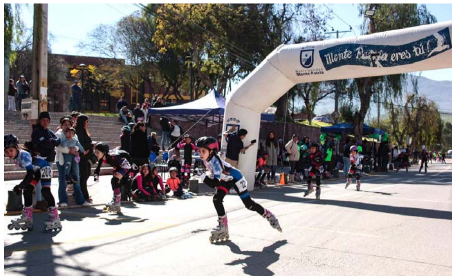
El patín carrera es un deporte que ha tomado fuerza en la Provincia del Limarí en el último tiempo.

El frío no fue impedimento para que decenas de niños y jóvenes llegaran hasta el sector del parque bicentenario para participar de esta actividad convocada por la Oficina Municipal y