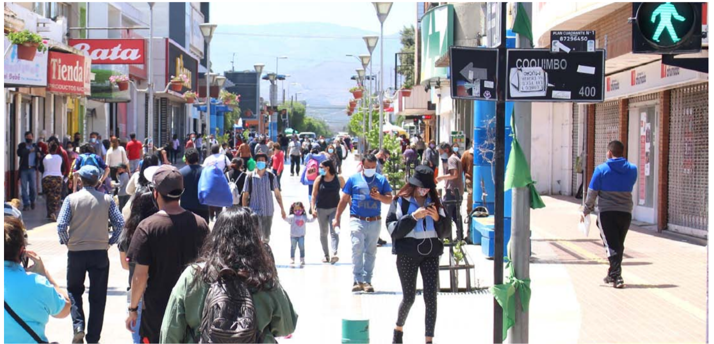
El comercio tradicional de Ovalle ha acortado sus horarios de atención, al sentirse amenazados por la inseguridad.

“Ya a las 18.00 horas muchos de los locales están cerrando, obligados también por la oscuridad de la zona, porque la iluminación quedó obsoleta y queda el centro de la ciudad muy oscuro. Para ello nosotros consideramos que es apropiado que exista un proyecto rápido para el recambio de luces en