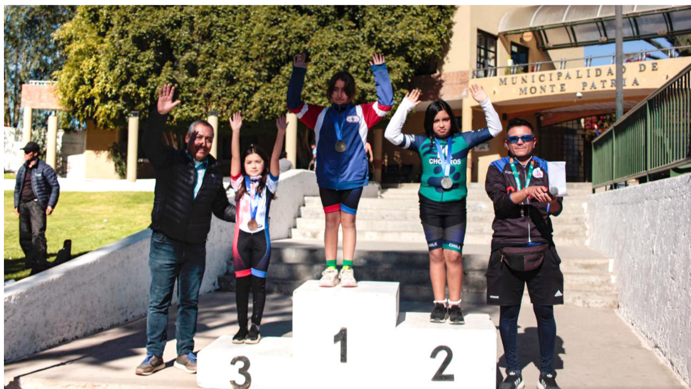
Durante la jornada se reconoció a los y las deportistas más destacadas.

Esta actividad, organizada por el taller de patinaje de la escuela Juntas, en coordinación Oficina de Deportes del municipio de Monte Patria, se disputó en las categorías infantil (2020-2028, 2017-2016, 2015-2015, 2013-2012), prejuvenil (2011-2010), adulto (2005-1989) y Máster