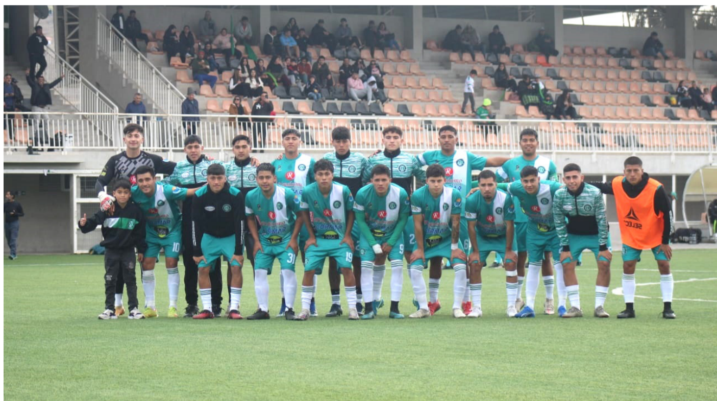
El "Equipo de la Gente" se alista para enfrentar a Coliseo este sábado 20 de julio en Punitaqui.

Con respecto a esta práctica y el rendimiento de sus dirigidos, Ahumada señala en conversación con Diario El Ovallino que "pude ver un plantel de jugadores con muchas condiciones y mucha juventud, también tienen la