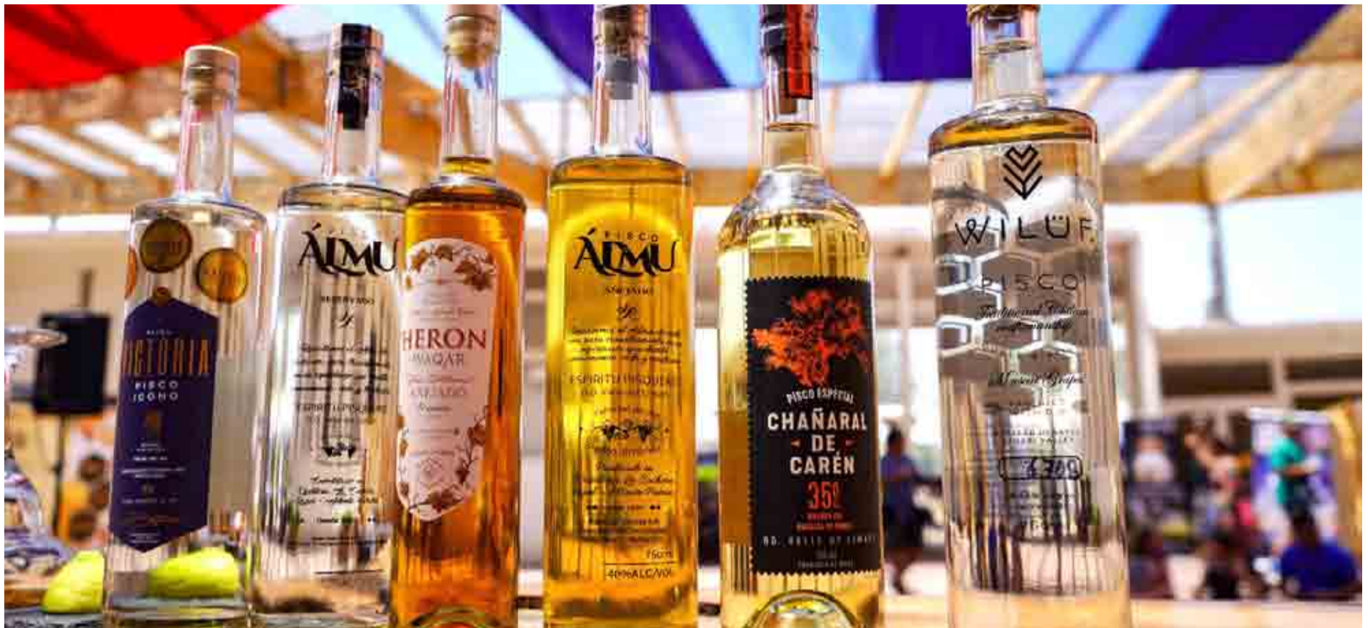
Cuatro importantes pisqueras de Monte Patria darán a conocer su historia y secretos a los visitantes.