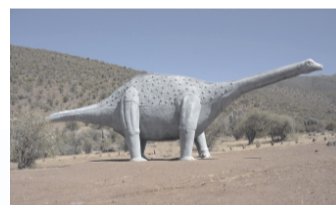
Réplica de titanosaurio, en el Monumento Natural de Pichasca.

El cráneo era corto y aplanado en el frente , con las cuencas de los ojos ubicadas atrás y las fosas nasales arriba, entre los ojos.