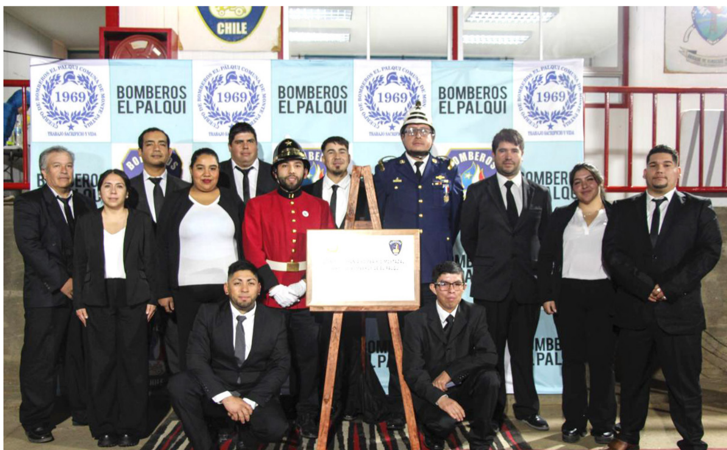
BRIGADA DE PEDREGAL SE CONVIERTE EN NUEVA COMPAÑÍA DE BOMBEROS 03