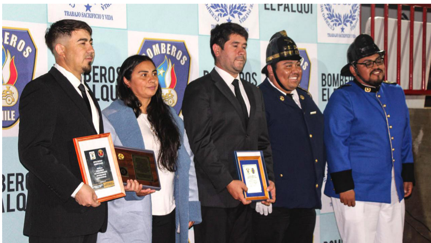
Emocionados estaban los bomberos de la localidad de Pedregal.

Si bien la ex brigada carecía de implementos y un lugar físico, se hizo la gestión con el Departamento de Educación municipal para asignar la antigua escuela de Chaguaral como el nuevo cuartel de la actual