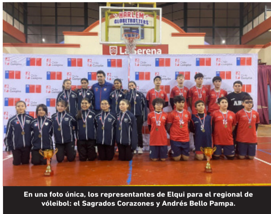
En una foto única, los representantes de Elqui para el regional de vóleybol: el Sagrados Corazones y Andrés Bello Pampa.