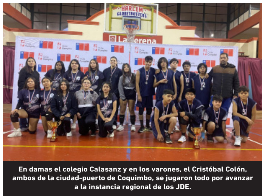
En damas el colegio Calasanz y en los varones, el Cristóbal Colón, ambos de la ciudad-puerto de Coquimbo, se jugaron todo por avanzar a la instancia regional de los JDE.

nuestra comuna y ser anfitriones de estos importantes juegos”, señaló. El Instituto Nacional de Deportes, en la región, tiene previsto realizar en agosto la final regional de la disciplina, paso previo a la final nacional que este año se llevará a cabo en la Región Metropolitana entre el 10 y 22 de octubre, para cuya ocasión se utilizarán los recintos de Santiago 2023.