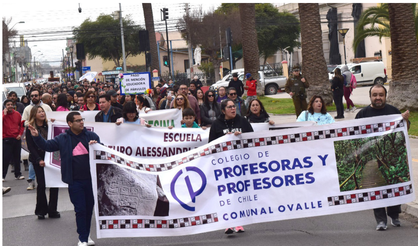
Para el próximo miércoles el Colegio de Profesores a nivel nacional hizo un llamado a paro de 24 horas.