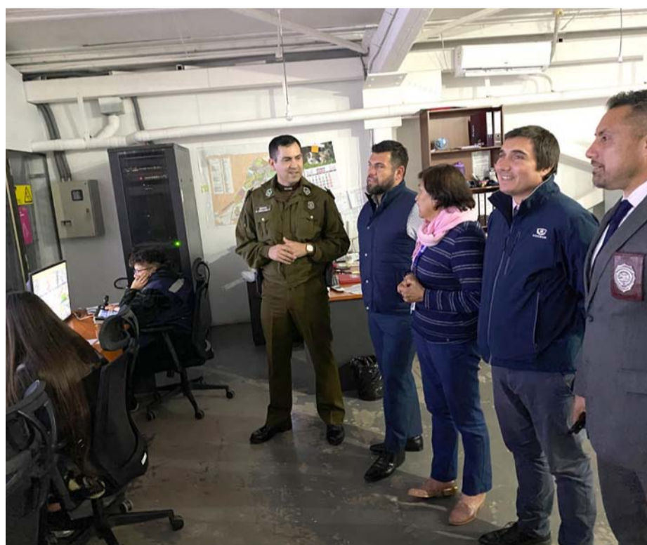
La central de cámaras es un apoyo a la labor de la Fiscalía, Carabineros y PDI.