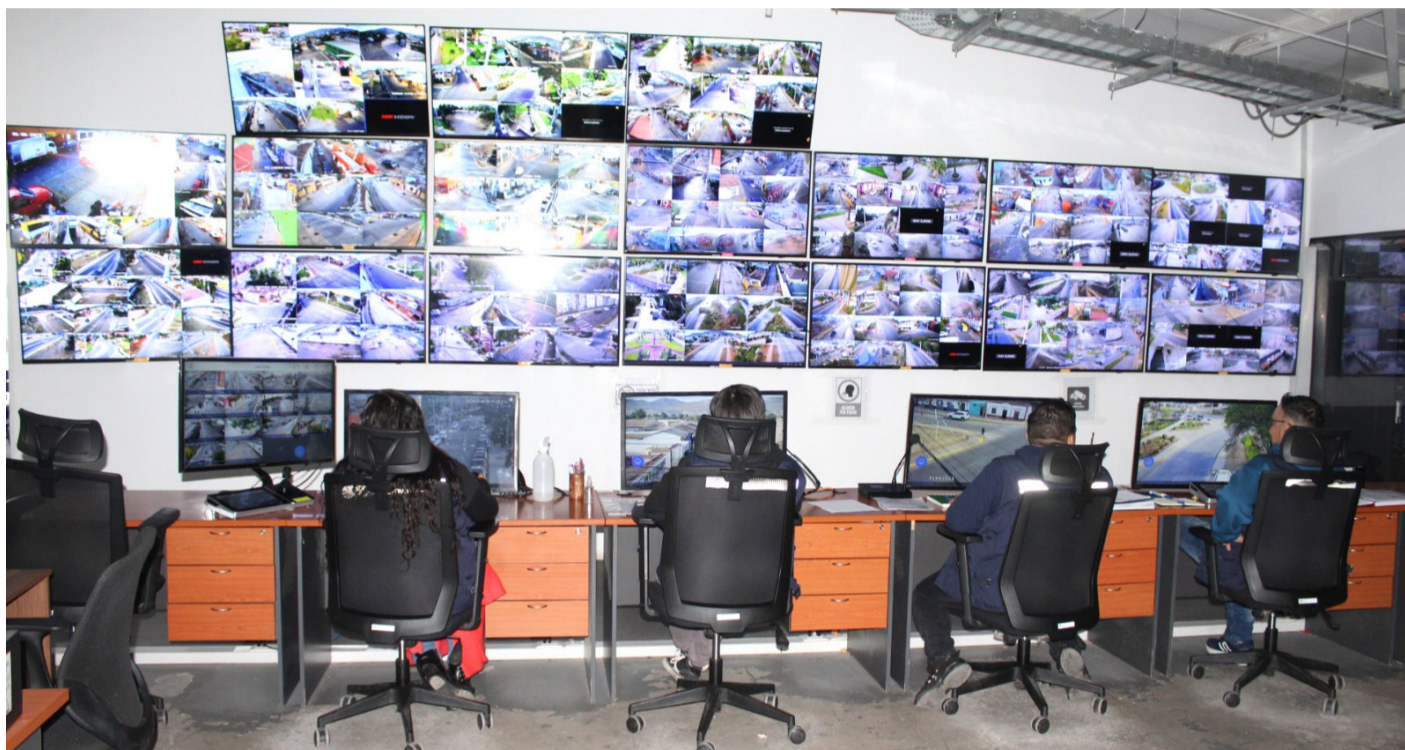
Un total de 345 cámaras de seguridad están instaladas a lo largo y ancho de la comuna de Ovalle.

El análisis arrojó que Ovalle es la sexta comuna con más cámaras de seguridad activas, llegando a un total de 354 que permiten obtener pruebas audiovisuales ante la presencia de un delito, como robos en lugares habitados y no habitados, asaltos, o si se producen accidentes de tránsito, lo que es de gran ayuda para la labor de Carabineros, la PDI y la Fiscalía local, para iniciar una investigación.