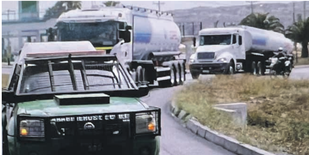
En la tarde del miércoles tres camiones cargados de combustibles fueron escoltados por Carabineros hasta Ovalle y Monte Patria.

“Hemos tenido que suspender actividades municipales para priorizar la entrega de servicio críticos de nuestra comuna. Esto no puede ser, la manifestación puede ser entendible o no, pero está generando serios daños a