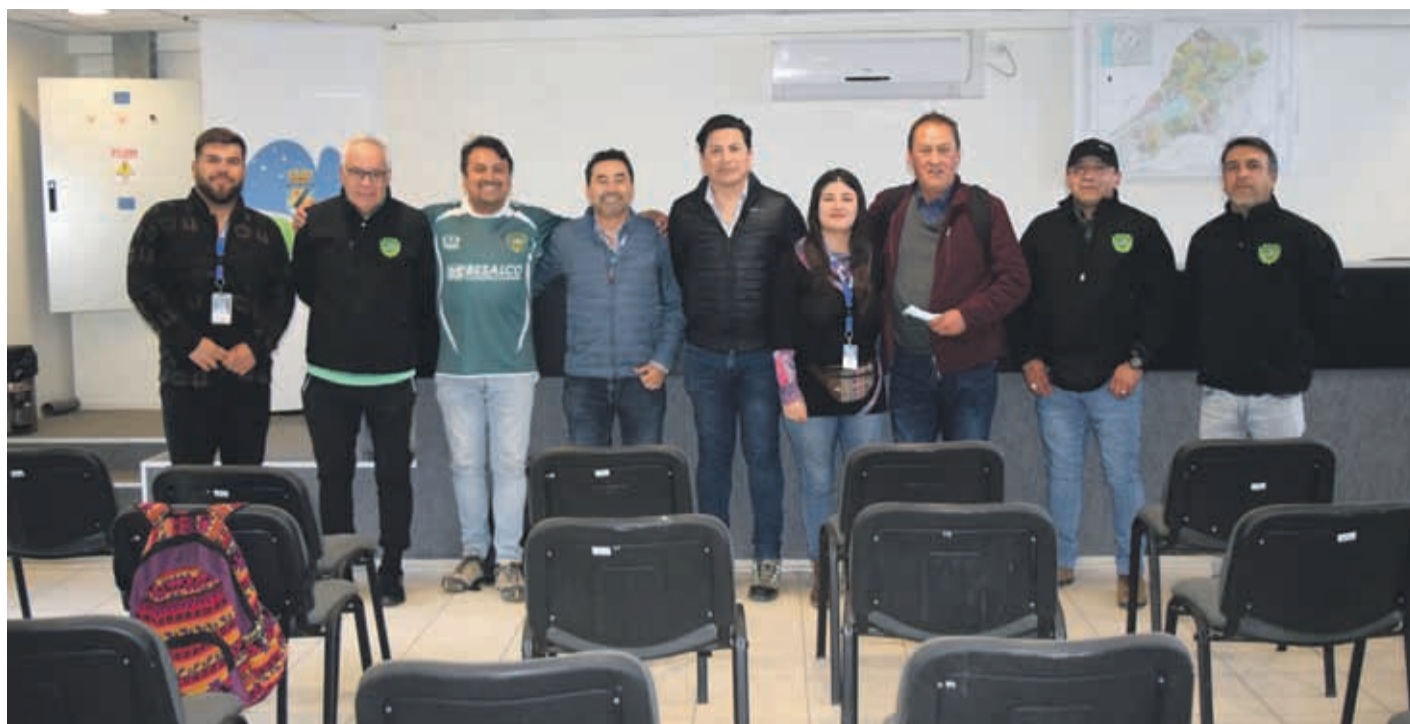
La directiva de Club Deportes Ovalle cuenta con el apoyo de los concejales en su objetivo por utilizar el Estadio Diaguita. LUCIANO ALDAY VILLALOBOS

"Nosotros agradecemos la disposición que hemos tenido de otros alcaldes, pero también es lógico que nuestra institución pueda hacer de local en su ciudad, por eso creemos que es importantísimo que nuestro