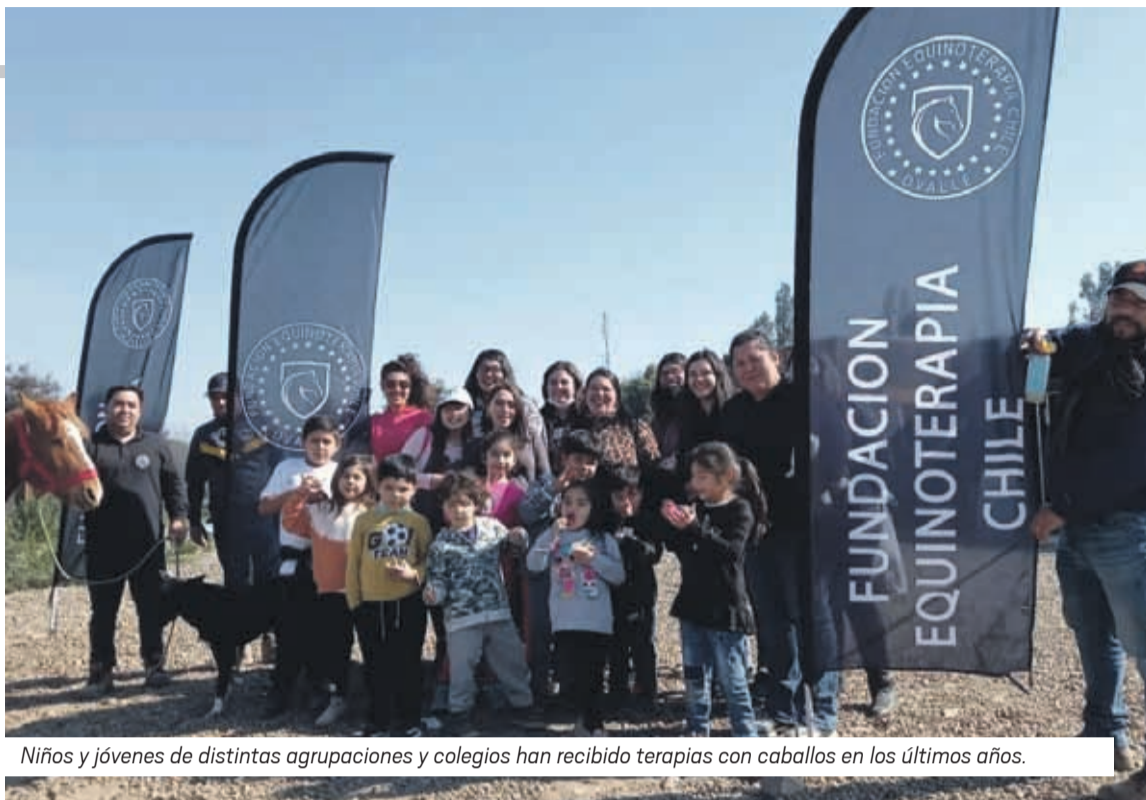
Niños y jóvenes de distintas agrupaciones y colegios han recibido terapias con caballos en los últimos años.

Jorge Arancibia, Fundación Equinoterapia