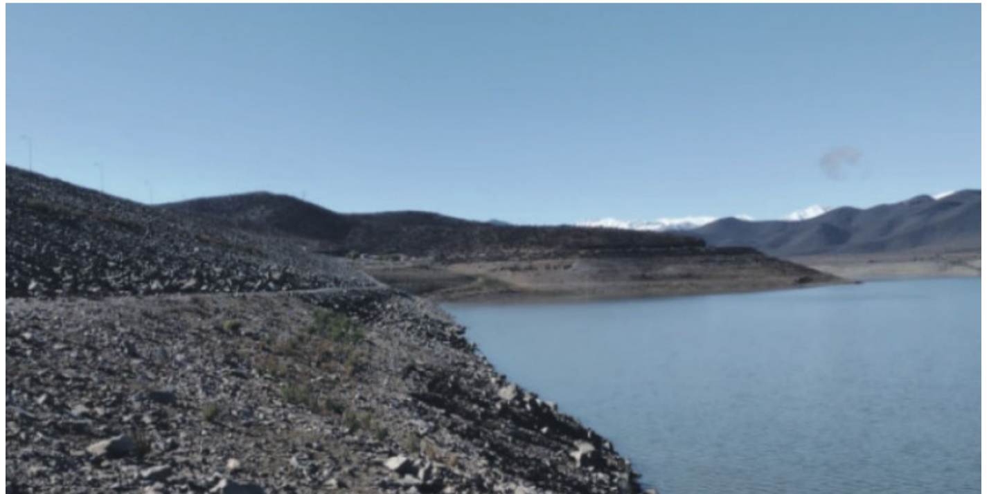
Aunque ya terminó la temporada de deshielos y entre los tres embalses de la provincia del Limarí se acumularon 116 millones m 3 , los efectos de la crisis hídrica siguen impactando a la zona.