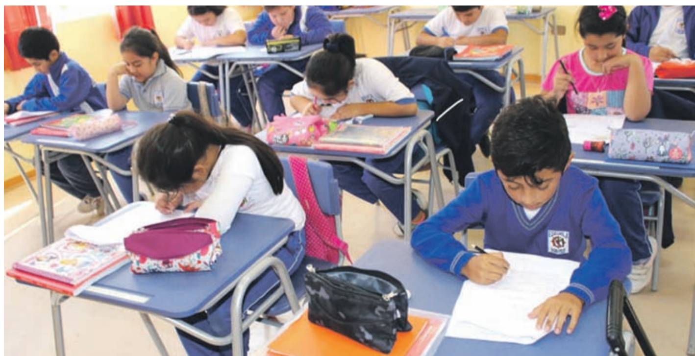
Docentes limarinos sondean la opinión de los apoderados con respecto al eventual regreso a clases.

Con respecto a la posible desventaja que argumenta el gobierno para llamar a clases, indicando que estudiando a distancia los alumnos de las ciudades poseen mejores