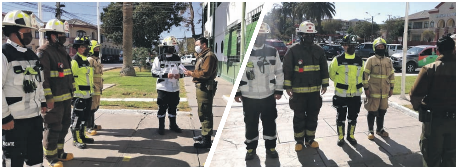
Bomberos de Ovalle entregando saludo a Carabineros de Ovalle.