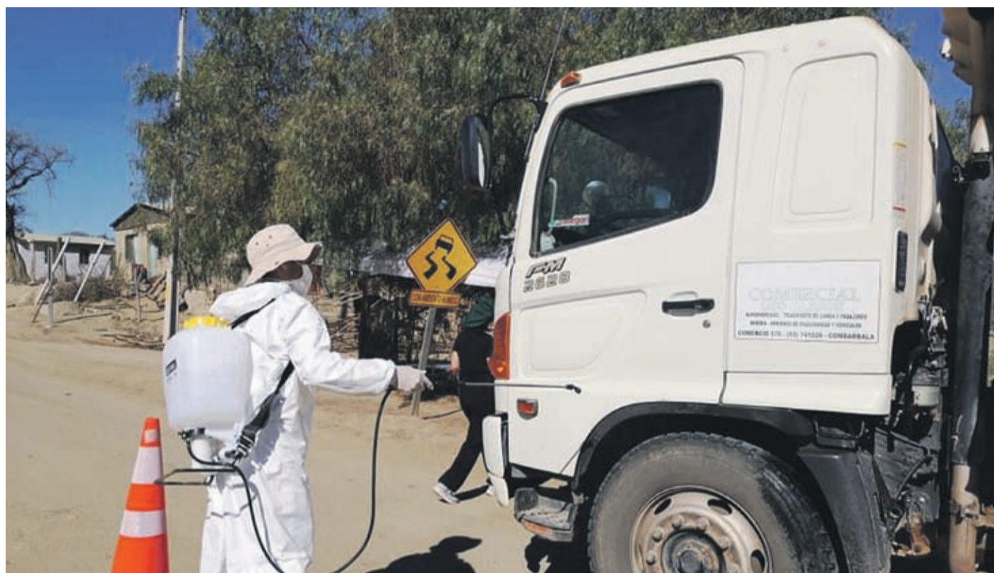
Desde Punitaqui sostienen que cada municipio ha solventado la crisis, entre ellos los controles sanitarios al ingreso de cada comuna.