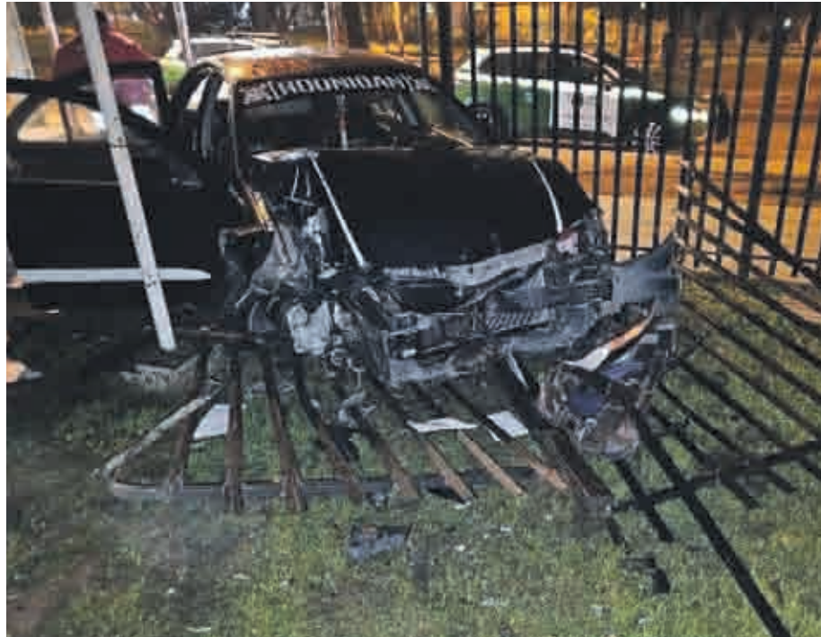
Incrustado contra la reja del municipio quedó uno de los vehículos accidentados este sábado en Ovalle.

Al llegar al lugar, agrega, "se verifica al conductor de este móvil, el cual se encontraba en evidente estado