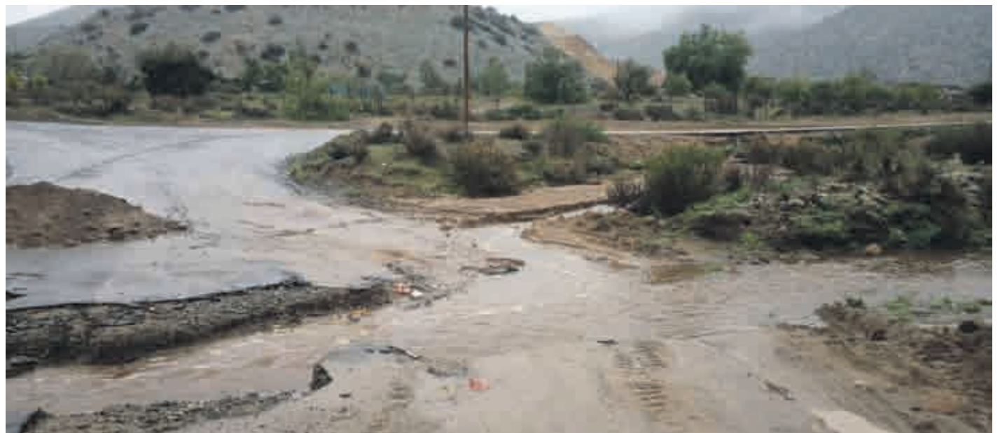
En Punitaqui también hubo afectación de caminos no enrolados tras las lluvias.

Sumado a esto, Herrera insistió en que “esta materia debería abordarse con algún proyecto de ley, para que Vialidad se haga cargo de todos los