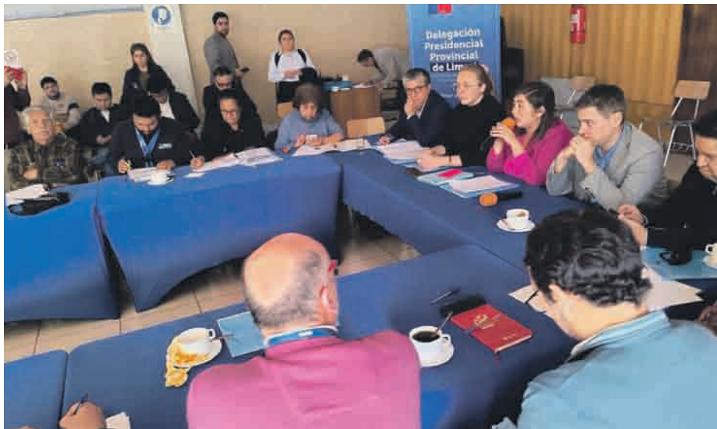
Cerca de 50 personas participaron en el encuentro realizado en Ovalle.

"Ha sido una instancia muy productiva donde los servicios del agro, Trabajo, Obras Públicas y Economía pudieron dar a conocer su oferta programática de medidas para mitigar la escasez hídrica. Sabemos que ante