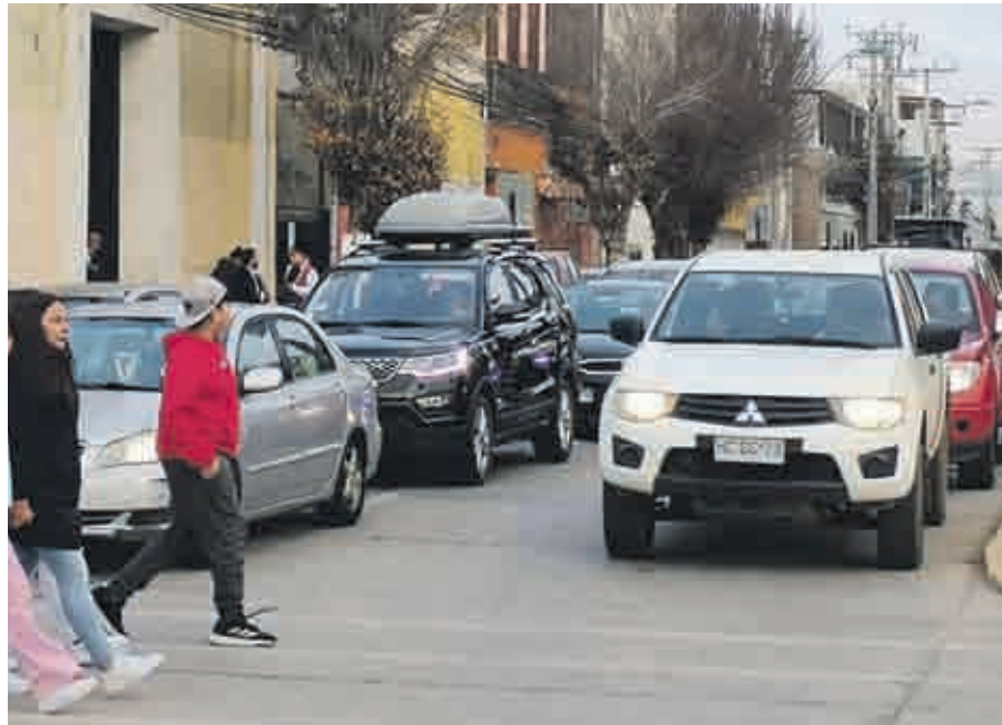
Se acerca la vuelta a clases y con ello retornan los atochamientos vehiculares. EL OVALINO

Por lo mismo, aseguró que como gremio, "siempre estamos tratando de incentivar que la gente use el transporte público. También le propusimos al alcalde la implementación de parquímetros. Además, aquí es la única parte en Chile donde se tiene