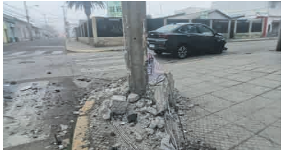
Imagen del accidente ocurrido en calle Socos con Arauco.

Asimismo, agregó, "el vehículo fue retirado de circulación y será derivado a los corrales municipales".